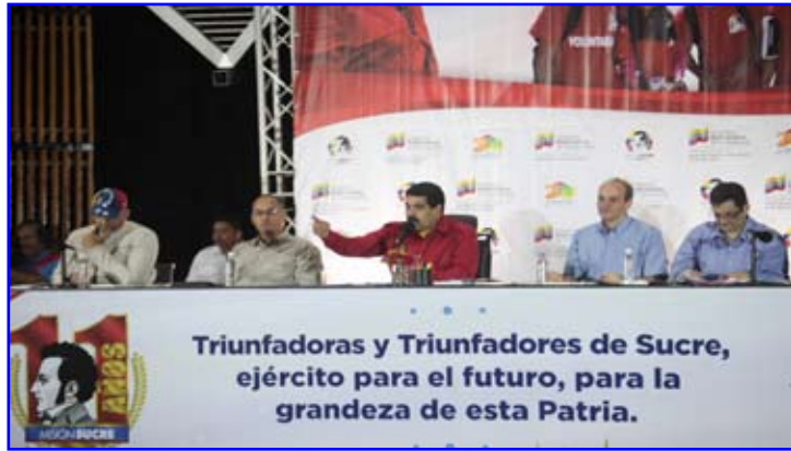
Triunfadoras y Triunfadores de Sucre, ejército para el futuro, para la grandeza de esta Patria.

Maduro, quien pidió al vicepresidente para el Área Social, Héctor Rodríguez, adelantar este nuevo proyecto, señaló que para ello serán necesarios aquellos estudiantes y profesionales graduados de la Misión Sucre vinculados con el conocimiento del trabajo social y de la actividad productiva.