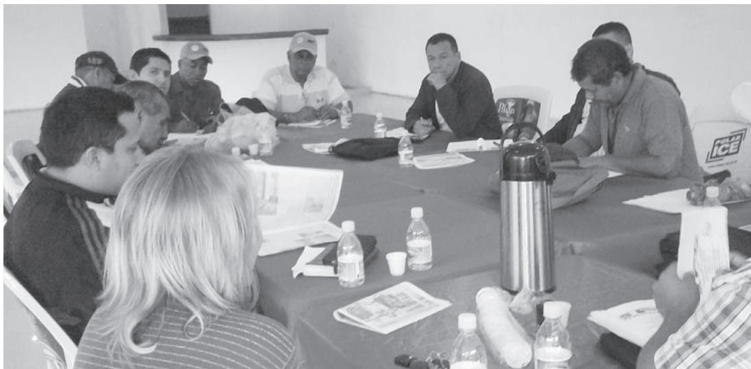
En las gráficas representantes del Gran Polo Patriótico, reunidos en Los Teques

Se estableció en el encuentro, la necesidad de que esta vanguardia política del GPP, asuma como modelo único la atención permanente de incorporar otras organizaciones políticas que hacen vida activa en el estado Miranda e impulsar los diversos entes políti-