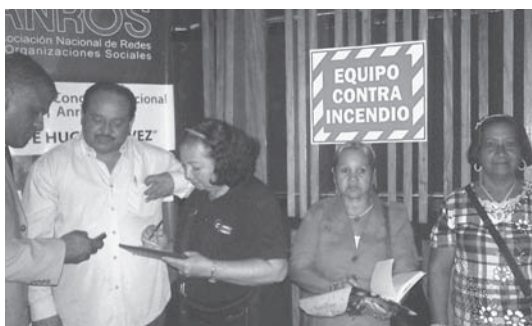
Delegación de Miranda presente en el foro internacional de movimientos sociales “Cmdte Hugo Chávez”

O.J. Castro.- En la Sala Plenaria del Parque Central en la ciudad de Caracas, se llevó a efecto con todo éxito, el encuentro de movimientos sociales “Cmdte Hugo Chávez”, todos los asistentes al evento social políticos, son pertenecientes a colectivos y organizaciones productivas, partidos políticos, gremiales y sindicales, así como miembros de las más diversas formas de grupos organizados que se han formado en nuestros pueblos; en este evento internacional se ratificó el carácter revolucionario y antiimperialista de las organizaciones asistentes. En sus planteamientos se especificó la lucha de todos los pueblos explotados y oprimidos del los habitantes del planeta, en el mismo acto se decidió realizar esfuerzos dirigidos a la búsqueda de un mun-