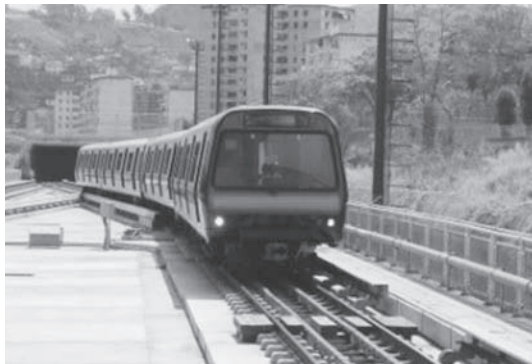
En las gráficas una muestra de Los Teques de ayer y lo que es hoy

Como parte de estos grandes avances se han construido nuevos urbanismos, a través del programa Barrio Nuevo Barrio Tricolor se han transformado las barriadas, actualmente se construye una circunvalación que atravesará la ciudad, para seguir dándole calidad y belleza a la población. Igualmente para el turismo se rescata el Tren El Encanto, Villa