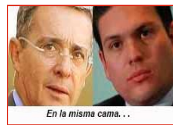
En la misma cama...