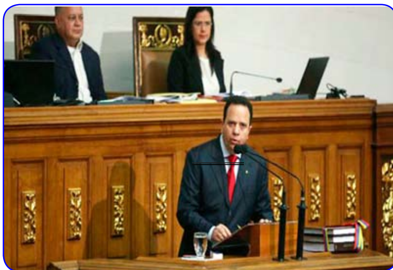
El mayor peso del presupuesto 2015 se soporta en ingresos no petroleros.

En la presentación ante la Asamblea Nacional del presupuesto nacional para 2015, el ministro de Finanzas, Rodolfo Marco Torres, reservó dos indicadores claves para determinar la salud económica del país: la inflación y el producto interno bruto.