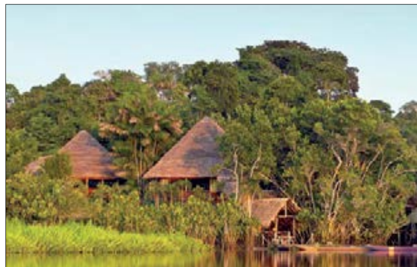
Pueblo indígena amazónico