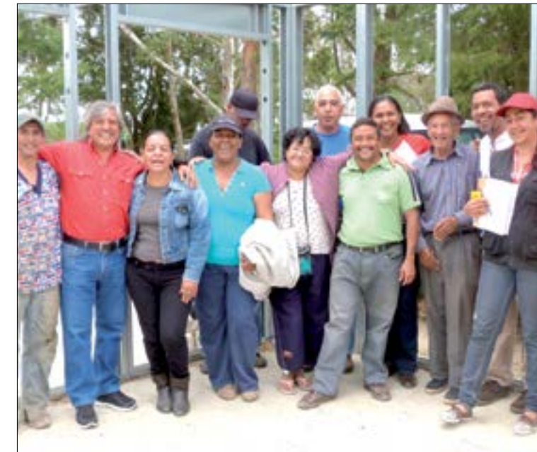
Bases de Misiones Comuna Hugo Chavez II

Visitamos el consejo comunal Las Lapas 2, en este consejo comunal se construye uno de los módulos de Bases de Misiones el mismo que está cerca de concluirse. Estas bases constan de tres módulos: el primero sirve de albergue a los médicos de la misión médica cubana que brindan atención permanente en las comunidades; el segundo