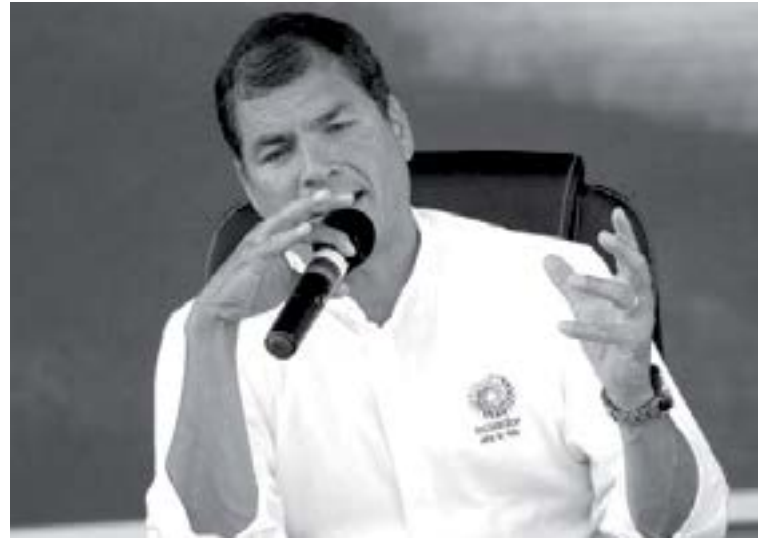
Presidente Rafael Correa

El presidente de la República, Rafael Correa, contestó al alcalde de Guayaquil, Jaime Nebot, quien puso en duda el conocimiento del Primer Mandatario sobre la historia de la urbe porteña. Nebot defendió hoy en un comunicado las estatuas que el Municipio colocó en la calle Panamá, en supuesta alusión a los oficios tradicionales de la ciudad, en especial la que representa a un niño lustrabotas. "Guayaquil superó la época en que muchos caminaban, o se cataban cacao en la calle Panamá descalzos; pero eso es parte de nuestra historia. Igual es el