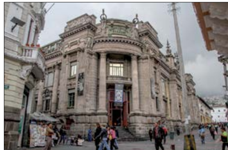
Banco Central de Ecuador

Según el documento, las exportaciones crecieron 7.3% y