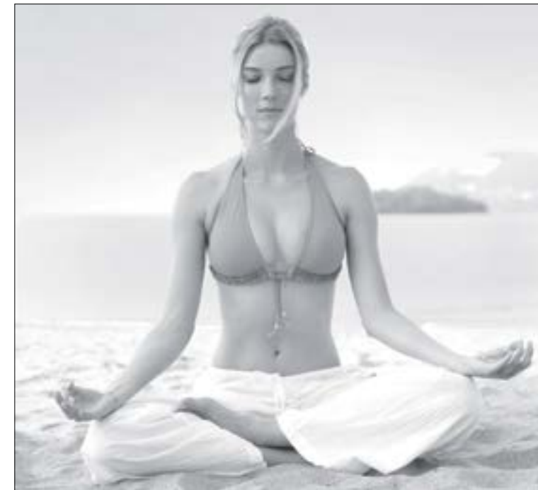
El yoga para un mejor estilo de vida

La exhalación te cura y te relaja. El énfasis que se hace en la inhalación generalmente crea un efecto estimulante o energizante en el sistema, mientras que el énfasis en la exhalación logra un estado más pasivo o relajado.