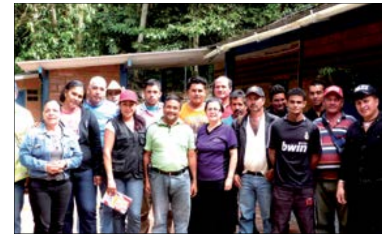
Visita al Consejo Comunal Codazzi La Florida

es para los trabajadores que gestionan los programas sociales de salud y alimentación; y el tercero sirve de espacio para las misiones educativas Robinson (alfabetización), Ribas (secundaria) y Cultura. Además el presidente Nicolás Maduro, aprobó los recursos para construir un Mercado de Alimentos (Mercal) en cada una de las Bases de Misiones Socialistas.