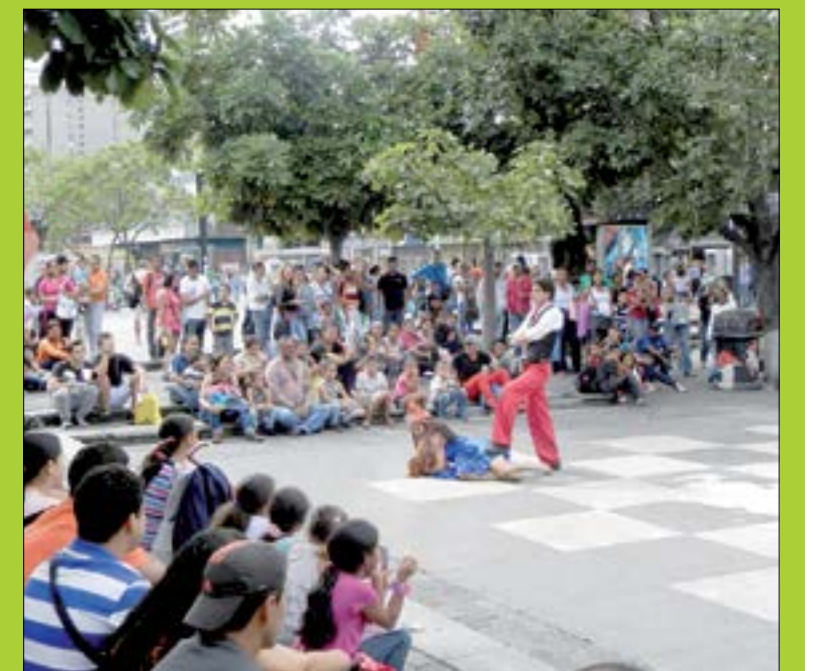
Presentación del Teatro de Calle en Chacaito, Caracas

de lo que sucedió y como se puede remediar para futuro el manejo indiscriminado en la extracción petrolera. Gracias a las decisiones inteligentes, precisas y oportunas el Ecuador a través de su Presidente Rafael Correa Delgado, ha tomado la batuta en el caso Chevron, ya que la transnacional estaba actuando en contra de la comunidad amazónica a pesar de la brutal contaminación y vejamen humano y ecológico que ocasionó.