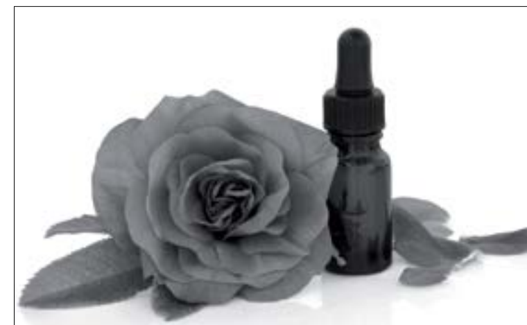
Flores de Bach

Fue de esta forma que desarrolló la Terapia de las Emociones. Después de más de 70 años, las Flores de Bach han sido probadas como un magnífico sistema para tratar los problemas físicos, mentales y emocionales de los seres vivos.