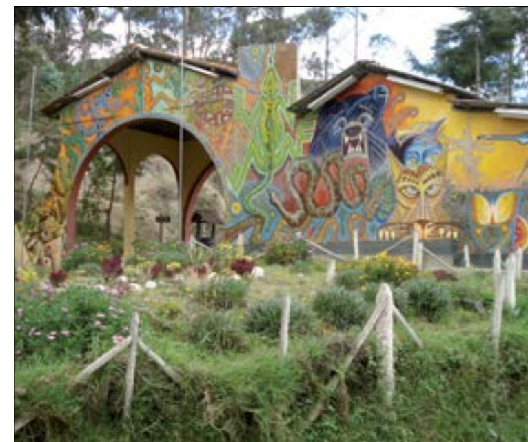
Entrada al Parque Nacional Podocarpus