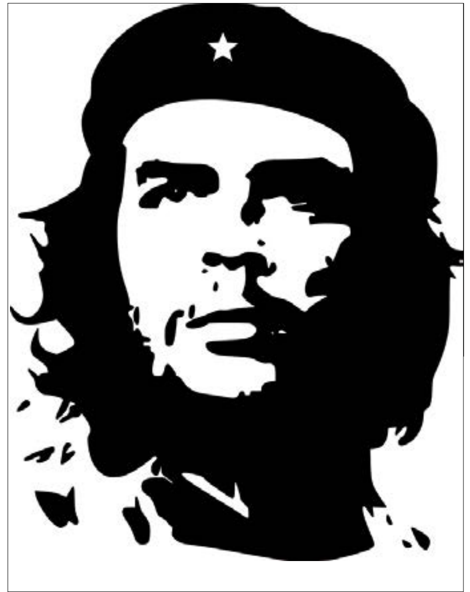
Ernesto "Che" Guevara

Además de representar a la isla ante la Asamblea General