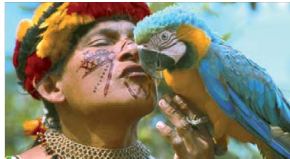
Habitantes de la zona y la hermosa fauna del lugar

formando más de 250 micro naciones, que incluyen a culturas como Siona, Secoya, Cofán, Shuar, Záparo, Huaorani y Quichua que están vivas. Los turistas pueden visitar los diversos alojamientos que ellos administran. Afortunadamente, los turistas llevan repelentes, un equipo adecuado para senderismo y vacunas que los ayuda a defenderse de los peligros de la selva, haciendo de esta región un divertido y emocionante destino. El Parque Nacional Podocarpus de las provincias del Ecuador, Zamora Chinchipe y Loja, atrae a los amantes de la naturaleza de todo el mundo debido a la variedad de vida vegetal. El parque también es conocido por sus muchas cascadas y lagunas. Debido al relativamente reciente descubrimiento de oro en la zona, las ciudades más pequeñas como Yantzaza han aumentado considerablemente de tamaño en las últimas décadas. Yantzaza, un pueblo minero, tiene una serie de hoteles y restaurantes a disposición de los visitantes. La atracción más destacada que ofrece la ciudad es el Valle de Yantzaza o Valle de las luciérnagas. Por su proximidad a la frontera con Perú, algunos viajeros pasan a través de la pequeña ciudad en su viaje hacia el norte de Perú. Una actividad divertida en la ciudad de Zamora es una visita al Refugio Ecológico Tzanka, un centro de rescate de vida silvestre donde los visitantes pueden ver animales como monos, loros,