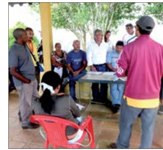
Gobierno de Calle, realizado en la Comuna La Peñita con Visión de Futuro, en el sector denominado Casa Amarilla