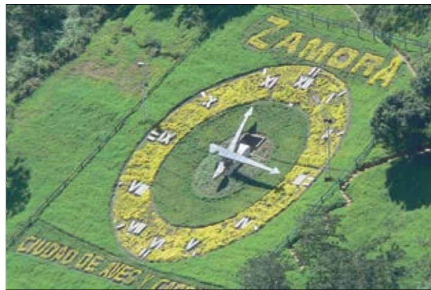
El Reloj Zamora

do es para los trabajadores que gestionan los programas sociales de salud y alimentación; y el tercero sirve de espacio para las misiones educativas Robinson (alfabetización), Ribas (secundaria) y Cultura. Además el presidente Nicolás Maduro, aprobó los recursos para construir un Mercado de Alimentos (Mercal) en cada una de las Bases de Misiones Socialistas.