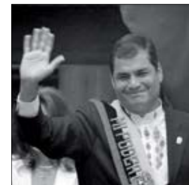
Presidente Rafael Correa

La Corte Constitucional (CC) se pronunció el 31 de octubre, sobre el paquete de enmiendas enviado por los asambleístas del bloque de Alianza PAIS: 16 de las 17 propuestas serán tratadas por la Asamblea Nacional como enmiendas a la Constitución.