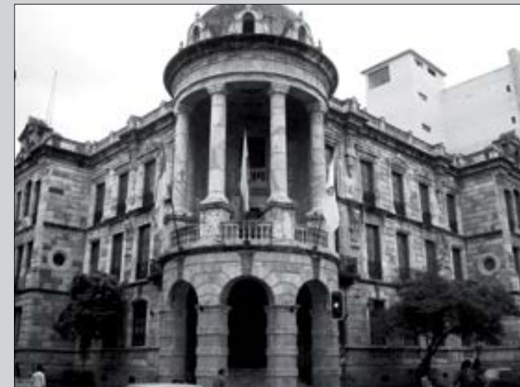
Día de la Independencia de Cuenca