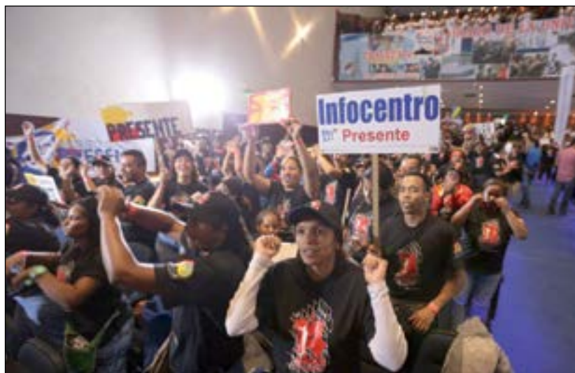
Penetración de Internet alcanza el 50 % de la población