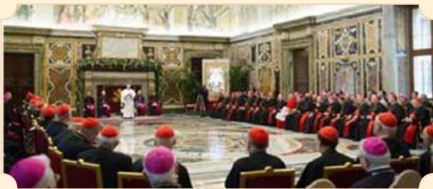
Ciudad del Vaticano lunes 22 de diciembre de 2014

Los principales administradores del Vaticano probablemente esperaban este lunes un intercambio de cumplidos en su reunión anual navideña con el Papa Francisco.