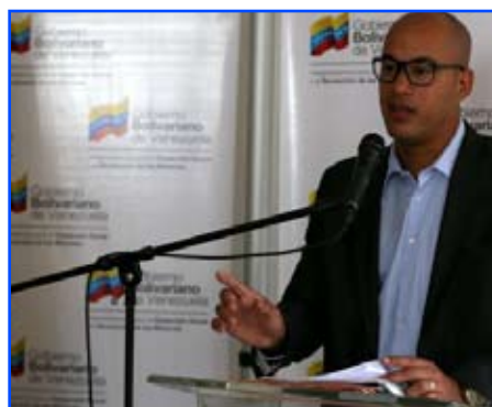
Caracas, 07 Ene.

El Gobierno venezolano suscribió con las principales empresas chinas de telecomunicaciones acuerdos para la dotación de escuelas con equipos de última tecnología, informó este miércoles desde Beijing el ministro del Poder Popular para la Educación, Héctor Rodríguez, quien acompaña al Presidente Nicolás Maduro en la gira de trabajo que el jefe de Estado realiza por China para fortalecer alianzas que potencien el desarrollo productivo del país.