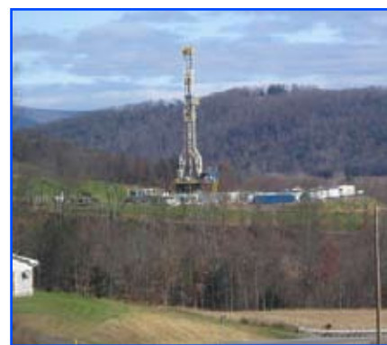
Caracas, 07 Ene. AVN.