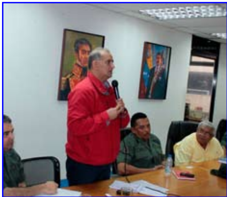
AVN - Reunión del dispositivo de resguardo Navidades Seguras 2014 en Anzoátegui.

Se realizó una reunión con los representantes de los organismos militares, policiales, de investigación y de prevención del estado Anzoátegui, con el propósito de unir esfuerzos en la aplicación de estrategias efectivas.