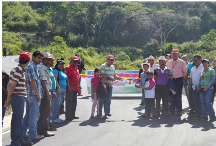
Rangel Silva Inspecciona vías agrícolas.

La obra contó con una inversión de 4.4 millones de bolívares y fue ejecutada en tan solo dos meses. El Gobernador realizó una inspección a otras vías en la zona y se comprometió en recuperarlas.