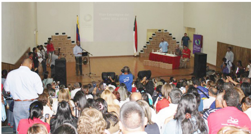
En el Foro Bolivariano asistieron 504 directoras y directores de instituciones educativas del estado Trujillo.

El evento se realizó en el Foro Bolivariano de Valera, donde el titular de educación explicó cada uno de los 10 desafíos que forman parte del mencionado plan, cuyos alcances están previstos hasta el 2024.