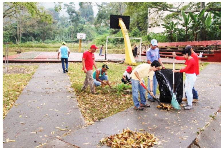
Los trabajadores de la Casa Hugo Chávez, Agrotiendas y Patios Productivos unieron esfuerzos para recuperar los espacios.