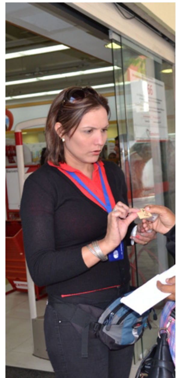
Las mujeres embarazadas y las personas de edad avanzada son atendidas con prioridad.

“Nos corresponde como Gobierno asumir una contraofensiva para hacerle ver a la gente que estas colas son anormales. Estamos seguros que nuestras acciones le van a partir la