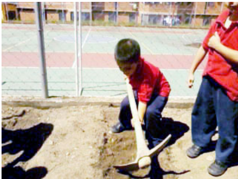
Este plan permite la formación de los pequeños en la agroproducción.