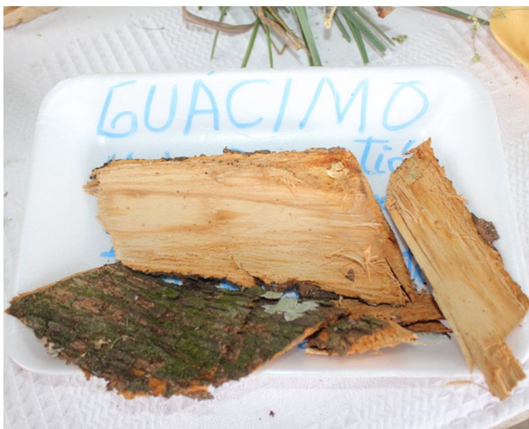
La concha del árbol de Guásimo, mediante una infusión sirve para calmar la acidez y también favorece la densidad ósea.

También es utilizada en muchas partes del mundo para enfermedades y como reconstituyente. En nuestro país, desde hace algunos años, se emplea para la alimentación animal, por sus propiedades alimenticias.