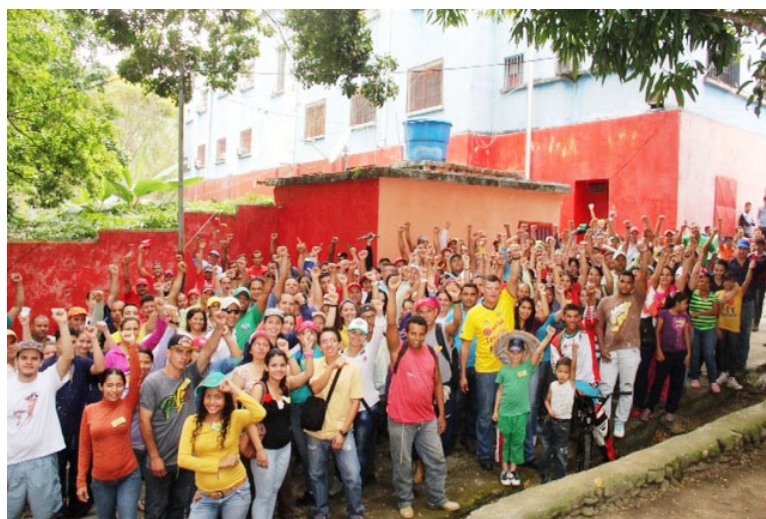
Se demostró que Agrotrujillo es un verdadero equipo.

Esta gestión de recuperación contribuirá a la Ofensiva Económica en el marco de la producción agrícola para garantizar la Soberanía Agroalimentaria. Agrotrujillo también donó a esta institución kits deportivos.