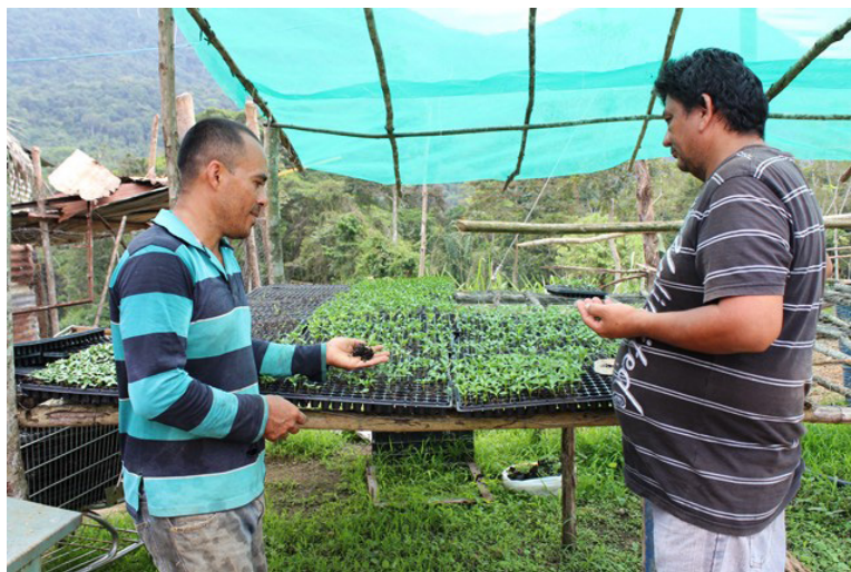
Los agricultores germinan las semillas en un invernadero artesanal.

de las plantas, y aconsejó no cosechar en las primeras horas de la mañana, para evitar que se malogren.