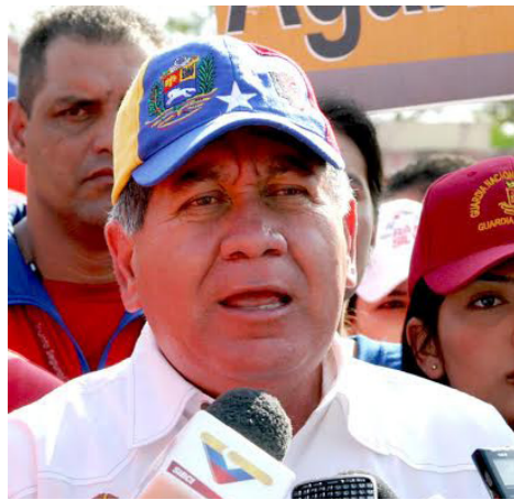
El Gobernador Bolivariano, G/J Henry Rangel Silva, encabeza el Comando Cívico, Popular y Militar.

“Este plan busca garantizar la seguridad alimentaria en el estado Trujillo, acabar con las colas y equilibrar las cadenas de distribución, comercialización y venta para restablecer la normalidad”. Así lo destacó el mandatario regional, Henry Rangel Silva, quien además aseguró que se ha determinado que personas foráneas que se dedican al