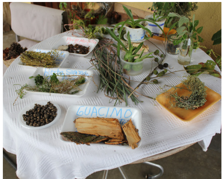
Varietades de plantas medicinales que pueden cultivarse en un huerto familiar.