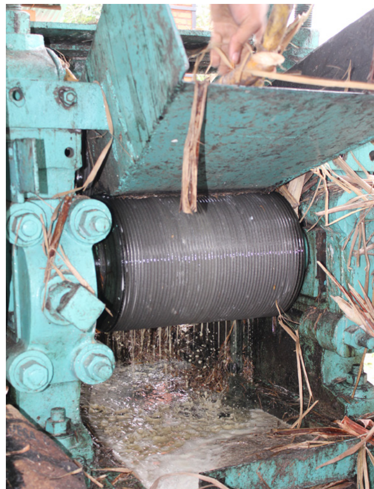
Este molino conserva el método tradicional para el procesamiento de la caña.

Una bebida que lleva el sello venezolano, es el papelón con limón, puesto que su principal ingrediente es