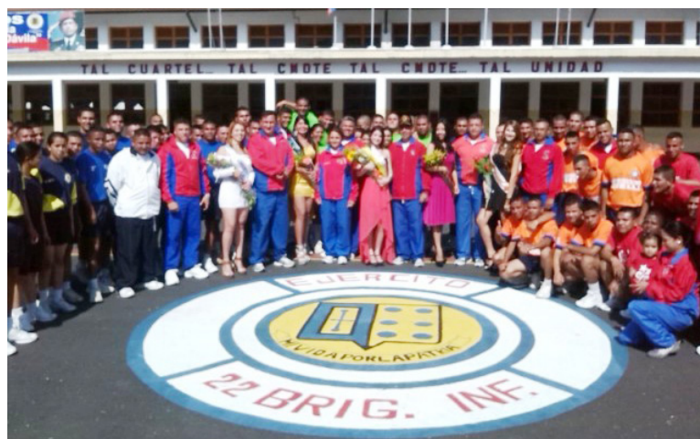
Equipos, autoridades y demás invitados durante el acto inaugural.

Estos encuentros son parte del "subsistema de la Fuerza Armada Nacional Bolivariana (Fanb), donde la atención debe marcarse en estos venezolanos que resguardan la seguridad del país, para que tengan la posibilidad de actividades deportivas, recreativas y saludables, destacaron representantes del Satrud.