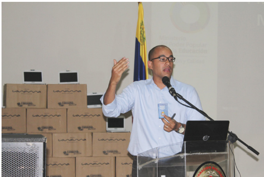
El ministro Rodríguez recomendó adaptar el plan a la realidad de cada institución.

La agenda del ministro Héctor Rodríguez, en la entidad, también contempló un encuentro con estudiantes de la Federación Venezolana de Educación Media del estado Trujillo, en la unidad escolar Barrio Nuevo en La Floresta. También, como Vicepresidente de Desarrollo Social y Revolución de las Misiones asistió a una jornada de trabajo en la base de misiones La Montañita, en la parroquia Mercedes Díaz del municipio Valera.