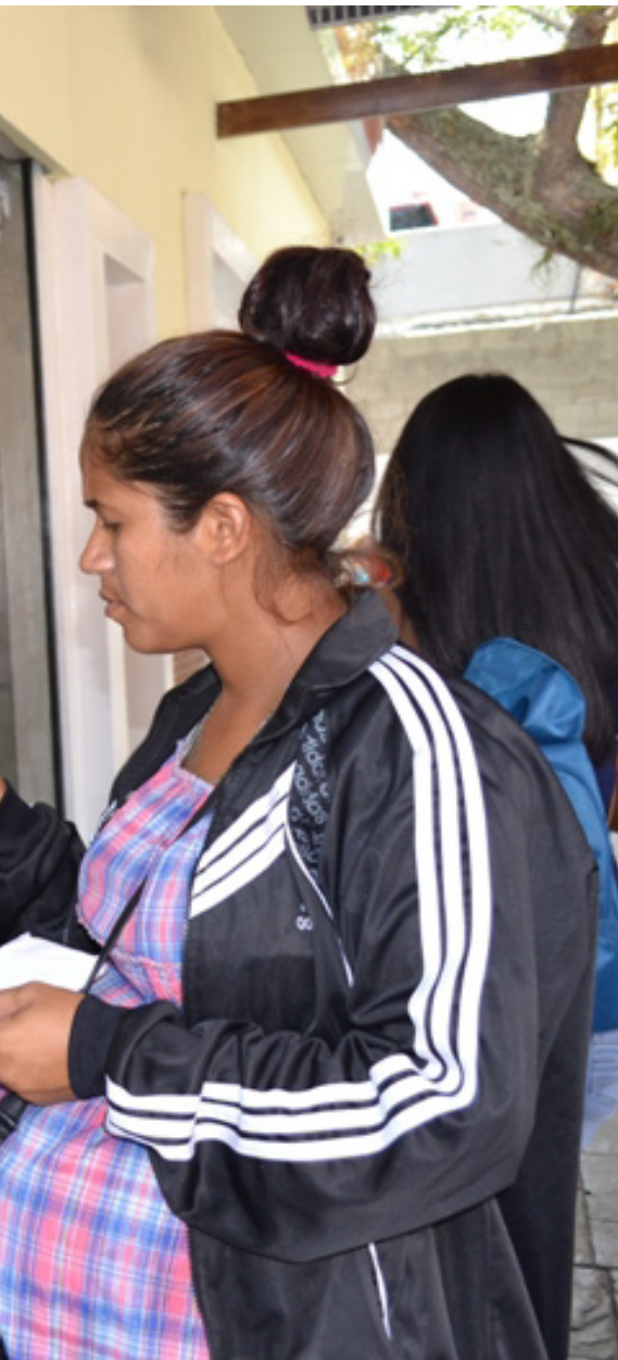
tercera edad o con alguna discapacidad son

El plan arrancó en los supermercados Sucasa La Plata y Las Acacias, Víveres Ridolfo y Súper Ridolfo, San Diego, Locatel, Farmahorro, Makro, Farmatodo y Coraluz con normalidad