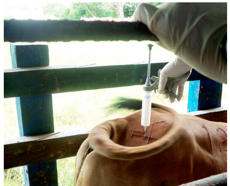
El próximo ciclo de vacunación arranca el 15 de abril