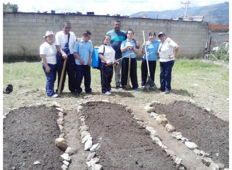
Huerto en el liceo "Juan Bautista Dalla Costa".

Recalcó que estos planes del Gobierno Bolivariano de Trujillo permitirán obtener un modelo de producción agroecológica sustentable que sea vitrina para incentivar a las demás instituciones del eje agroeco-