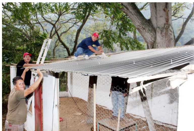
Sustituyeron el techo del galpón para gallinas ponedoras.