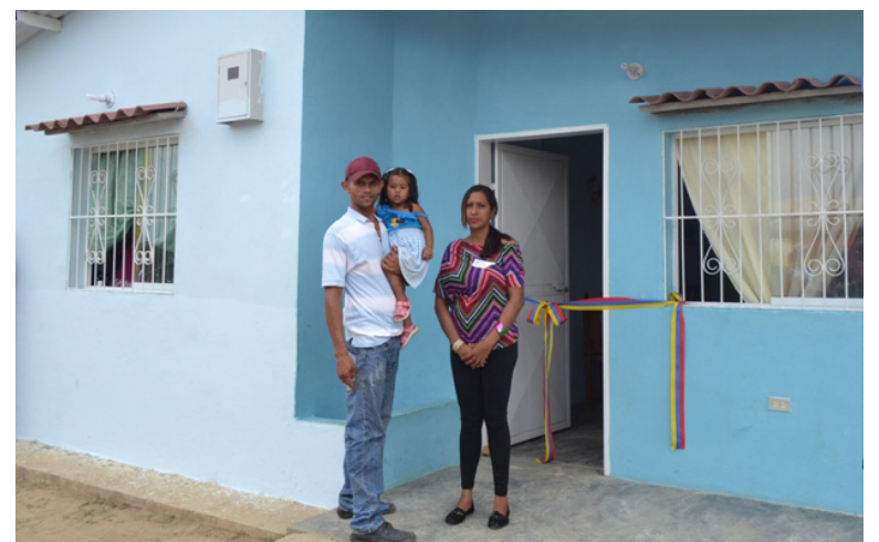
Poder Popular y Gobierno Regional consolidaron este proyecto.