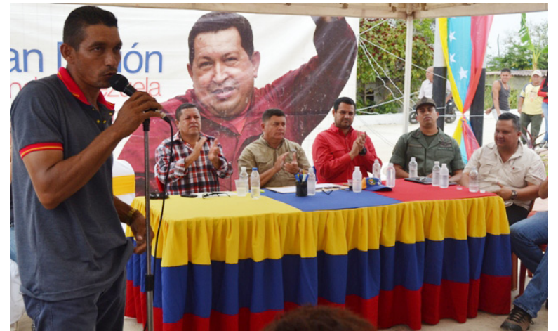
Beneficiarios expresaron y compartieron su exitosa experiencia.

Alertó sobre la necesidad de asumirnos todos como Chávez ante las amenazas