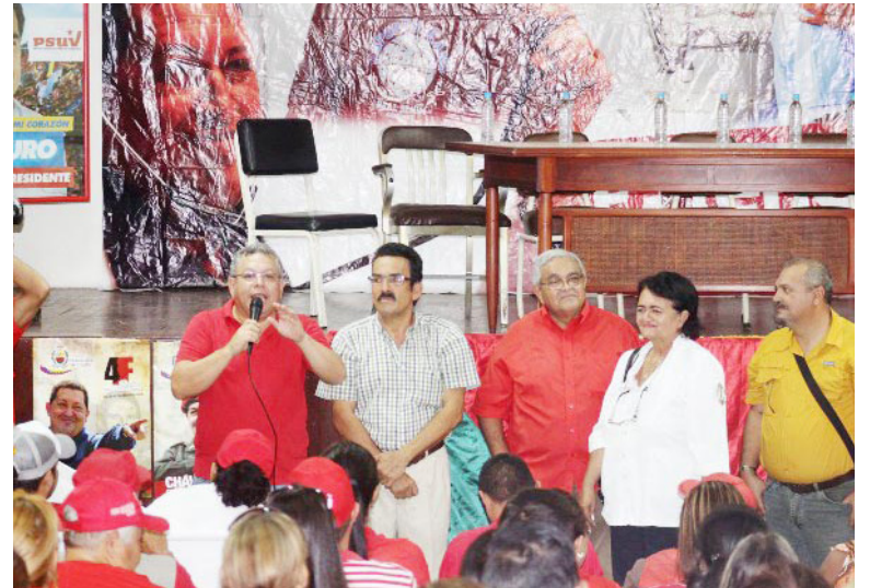
Los galenos alzaron su voz de apoyo a la Revolución Bolivariana.