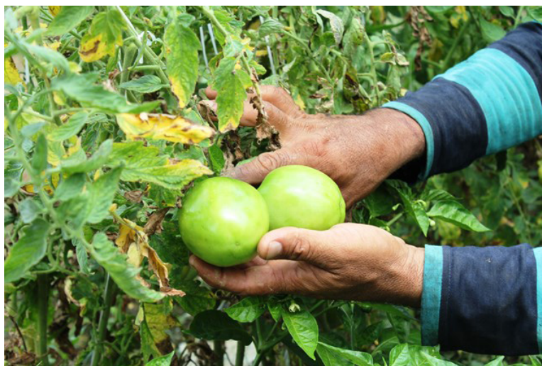
Los productores plantaron 12 mil nuevas plantas de tomate.

“Iniciamos la producción por nuestros propios medios. Comenzamos plantando 400 semillas de ají dulce, desde la primera agarrada hemos recogido seis sacos. Pasamos a las plántulas, con un mes de edad, de la bandeja a la tierra, donde tardan dos meses para iniciar su producción”, explicó el agricultor. Añadió que este cultivo es muy delicado, y que hay que fumigarlo para evitar que lo ataquen las plagas, principalmente gusanos, bachacos y rosquillas. De igual modo hay tener cuidado con la quema