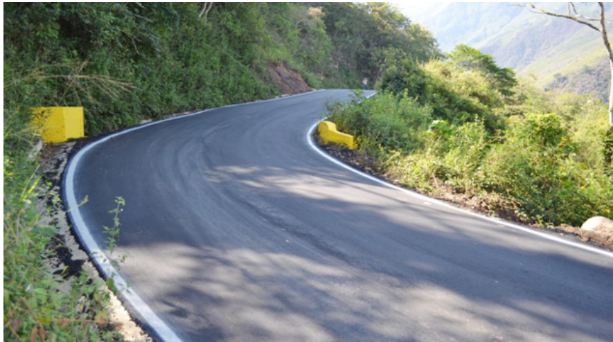
Inauguran carretera entre San Lázaro- La Manga.