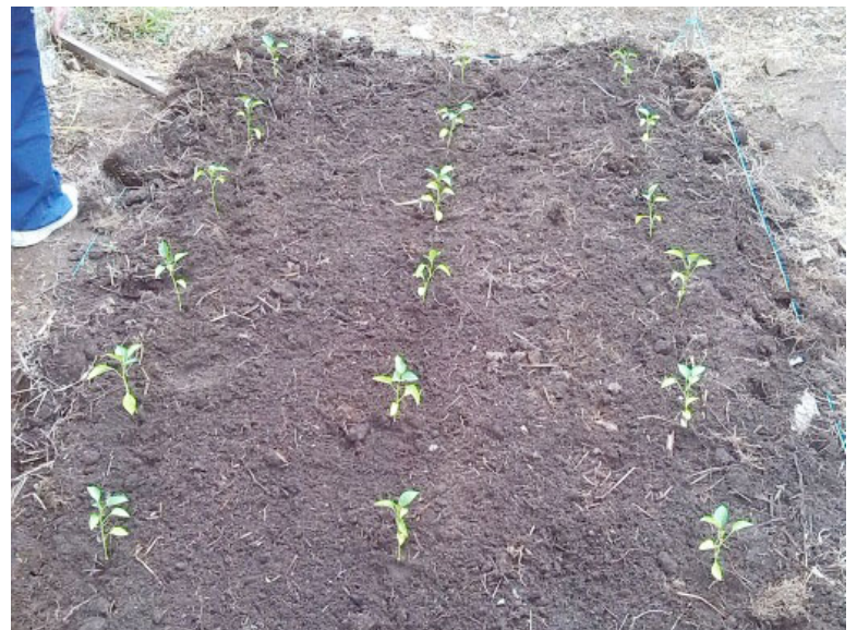
La cosecha del huerto escolar sirve para abastecer al comedor de la institución y a la comunidad.