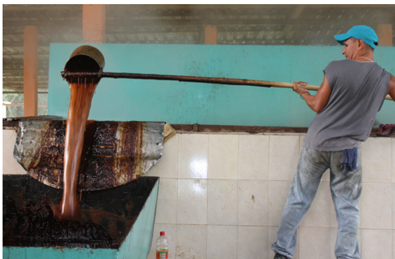
El guarapo de la caña se cocina durante 15 minutos, hasta llegar al punto de melcocha.

Se acerca la Semana Mayor y una de las tradiciones de pueblo trujillano es elaborar las famosas “conservas”. Los dulces los preparan en los hogares el día miércoles santo; las frutas varían, pero sigue siendo indispensable la panela, puesto que es el ingrediente que le da ese sabor y color tradicional que tanto gusta a las familias andinas.