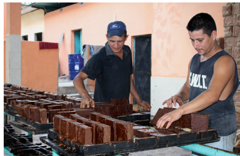
El precio de cada panela en el mercado varía entre los Bs. 50 y 60.