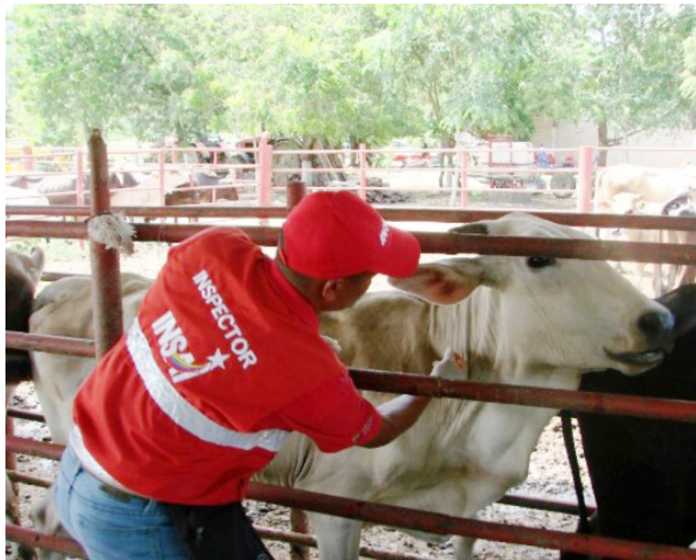
Venezuela cumple con los requisitos para la validación del programa oficial de aftosa.