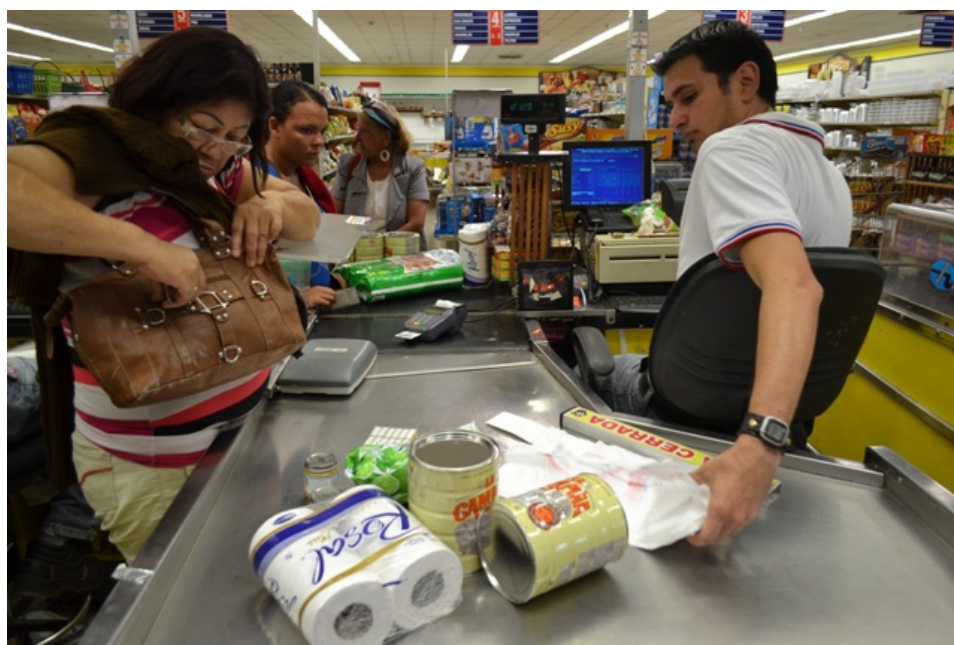
Los usuarios han realizado las compras de forma rápida y sencilla.