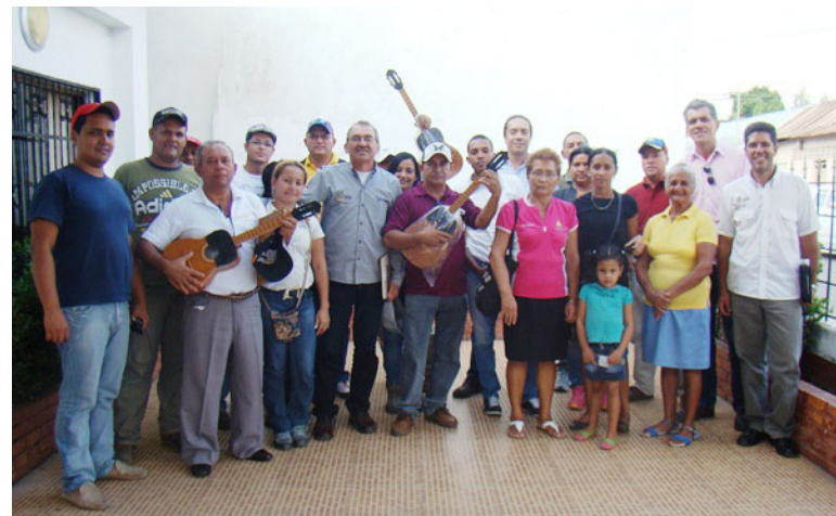
Participantes se comprometieron desarrollar la cultura de la parroquia.

También explicó que entre las funciones que cumplirá dicho órgano se encuentra el desarrollo de propuestas