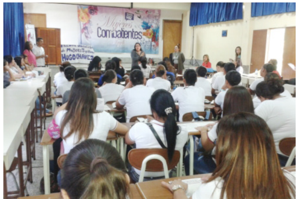
El objetivo es consolidar la plataforma unitaria de lucha de las mujeres Patriotas y Revolucionarias para que en igualdad de condiciones defiendan el Estado Socialista.

“Desde aquí proponemos que en los liceos se refuerce el tema de la educación sexual y la prevención de enfermedades venéreas, donde vuelvan a las escuelas con más ahínco los talleres por parte de los organismos competentes”, resaltó Angulo.