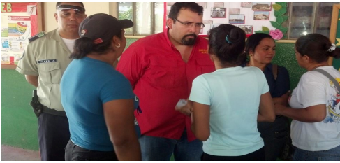
Alcalde David Velásquez, junto al personal de la Policía Comunal del IAPMS y habitantes de Santa Fé.