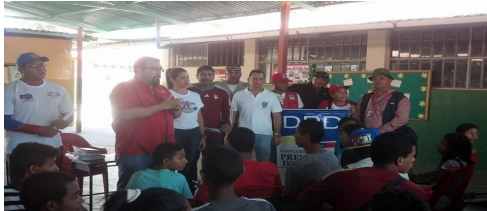
Equipo de la Policía Comunal del IAPMS participando en la Jornada Comunitaria Integral en Santa Fé.