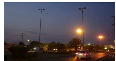
Carenancia del servicio de iluminación en la Av. Perimetral frente al Dique

Habitantes de la comunidad del Dique, visitaron nuestra sala de redacción para denunciar el malestar que genera en la colectividad, la grave problemática de alumbrado público en las adyacencias de ésta comunidad específicamente a la altura de la Avenida Perimetral, situación que se hace recurrente hasta la altura del sector Caigüiré, frente a los Coctelitos pasando por la urbanización Los Chaimas de la Parroquia Valentín Valiente. Asimismo, denuncian que han enviado cartas y efectuado visitas para solicitar a las autoridades de CORPOELEC SUCRE, se solviente dicha problemática que afecta el transito de personas por esa vía; poniendo en riesgo su vida por la carencia de iluminación. En este sentido se aprovecha la ocasión para hacer un llamado al Director de esa institución para que asuma con voluntad política de manera urgente una pronta respuesta ante las demandas de la población. Así mismo, denunciamos que como consecuencia del pasado corte eléctrico ocurrido el día Jueves 09/04/15 se dañó de manera total el transmisor de la emisora comunitaria Radio Catalana 1039. Fm, ante lo cual se precisa que responsabilicen con los daños causados para con ese medio alternativo de radiodifusión al servicio de las comunidades del Municipio Sucre.