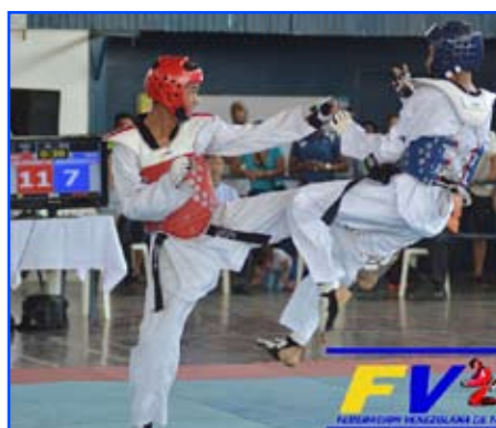
***El chequeo nacional celebrado en Guanta, Puerto La Cruz, permitió ob-

servar el talento humano para el ciclo 2020.