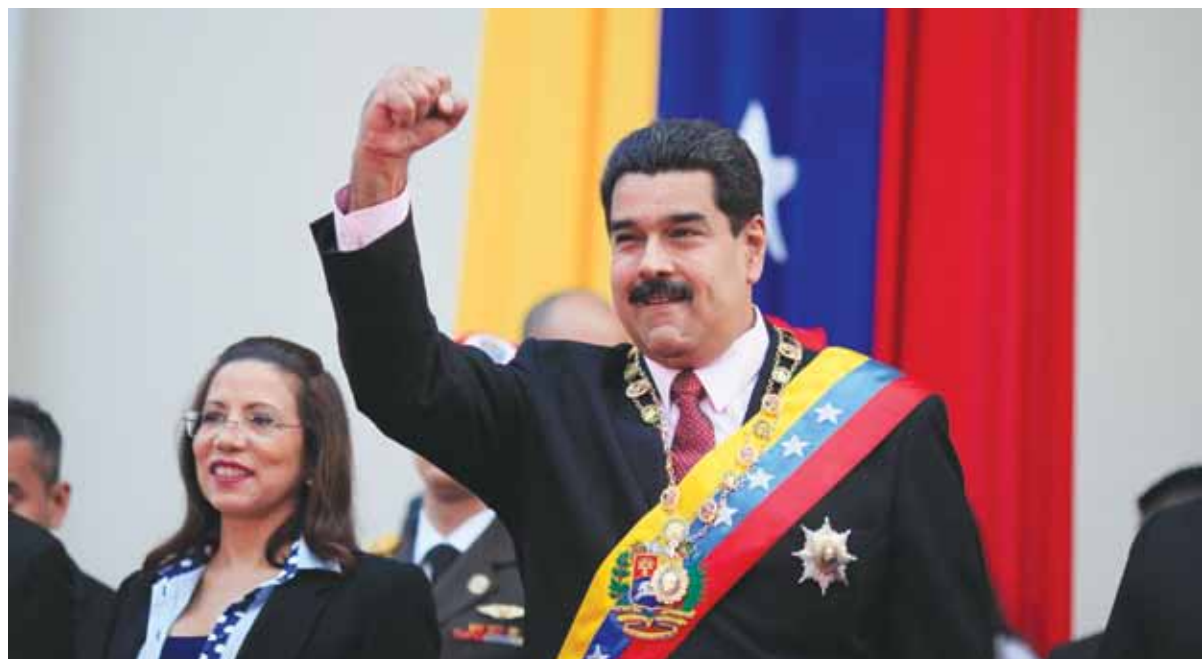
La defensa de la soberanía nacional fue el principal tema desarrollado por el presidente Maduro

Unión nacional, interés geoeconómico, el petróleo. Creo que nadie podría negar esto, interés geopolítico, geoideológico —se pudiera decir a los planificadores, a los