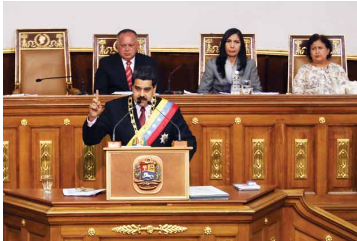
Maduro advirtió que el ataque no era contra él, sino contra el pueblo de Venezuela, contra la soberanía nacional

Ahora, este Gobierno de Guyana –no el pueblo de Guyana–, así lo siento y lo creo, ha asumido los criterios del viejo imperio británico contra Venezuela. No es