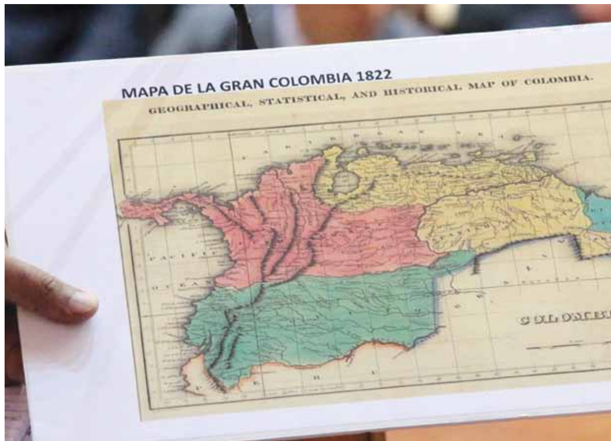
Presidente Maduro mostró varios mapas, como este de la Gran Colombia (1822) donde aparece el Esequibo como parte de nuestro territorio

conducta al contrario ha privilegiado en volver nuestras relaciones sobre la base de la construcción de una nueva confianza mutua entre países, dirigentes, pueblos; acompañar nuestras relaciones sobre la base de una poderosa cooperación energética, comercial, económica, cultural, sobre la base de un diálogo permanente entre las cancillerías, los presidentes.