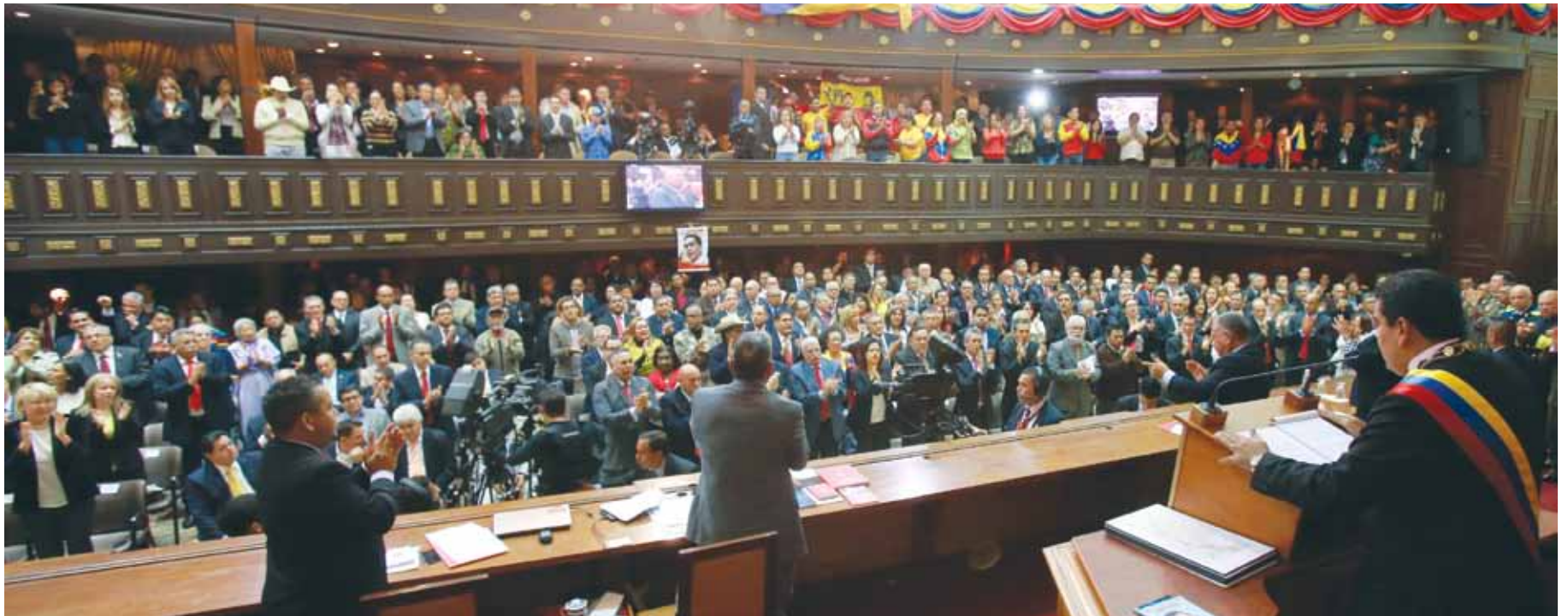
En el recinto de la Asamblea Nacional hubo una gran empatía con el mandatario nacional

la paz que tiene nuestro pueblo, el derecho a la soberanía, para defender nuestra Constitución, para defender el derecho internacional, para seguir avanzando en las políticas de integración, de unión de América Latina, del Caribe, de buena vecindad. Para eso he venido.