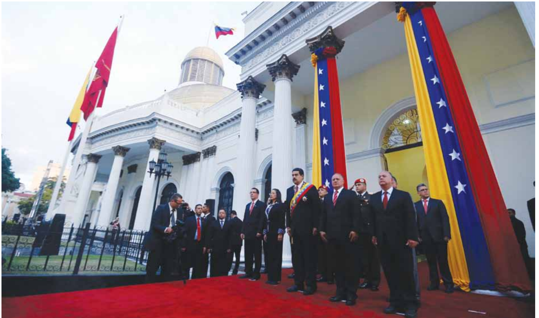
El presidente Nicolás Maduro recibió el respaldo de la directiva de la Asamblea Nacional y de los otros Poderes Públicos y militares