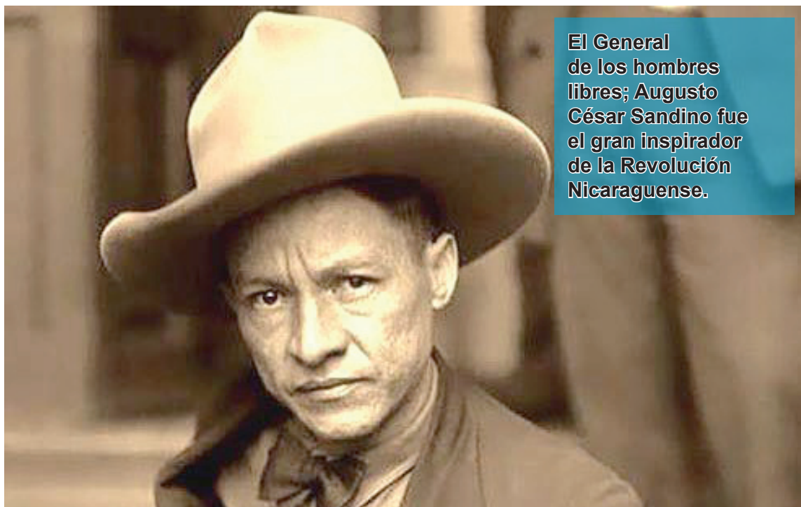
El General de los hombres libres; Augusto César Sandino fue el gran inspirador de la Revolución Nicaraguense.