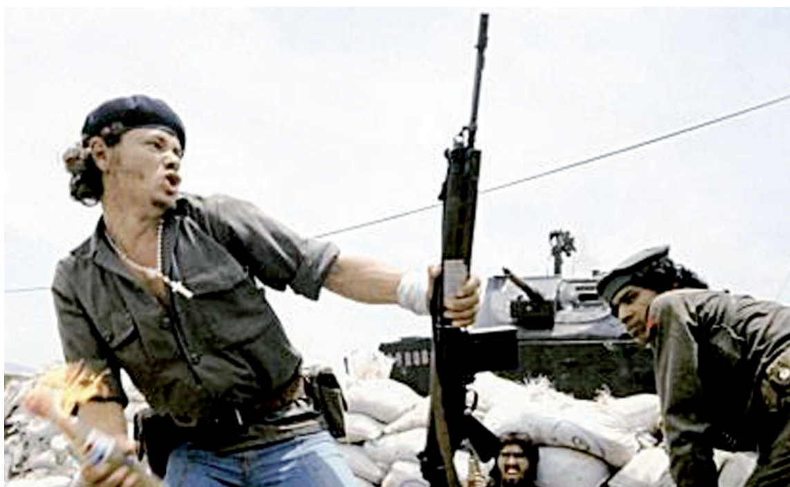
A los guerrilleros sandinistas los llamaban "Los muchachos". Ciertamente eso eran