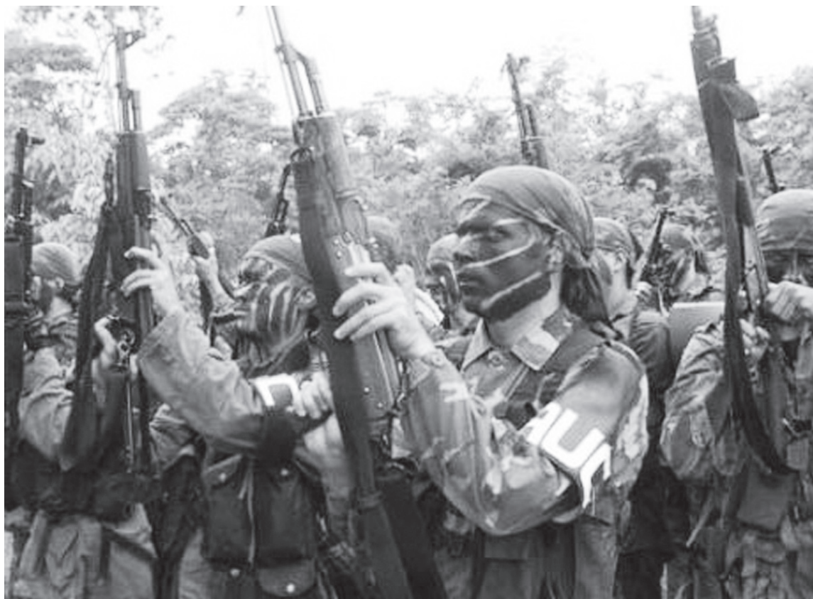
Paramilitares de la A.U.C. de Colombia infiltrados en barrios de Venezuela no andan en estos uniformes, pueden ser heladeros, vendedores playeros, bodegueros, etc. Hay que vigilarlos.

Sin embargo, en 2003 las AUC desarrollaron varias incursiones militares y ataques a territorio venezolano desde Colombia. El 19 de marzo aproximadamente 500 parami-