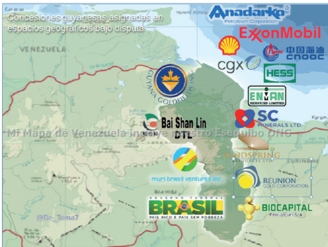
Obsérvese las concesiones que ha hecho ilegalmente Guyana a empresas extranjeras en el territorio esequibo (Pág. 4-5)