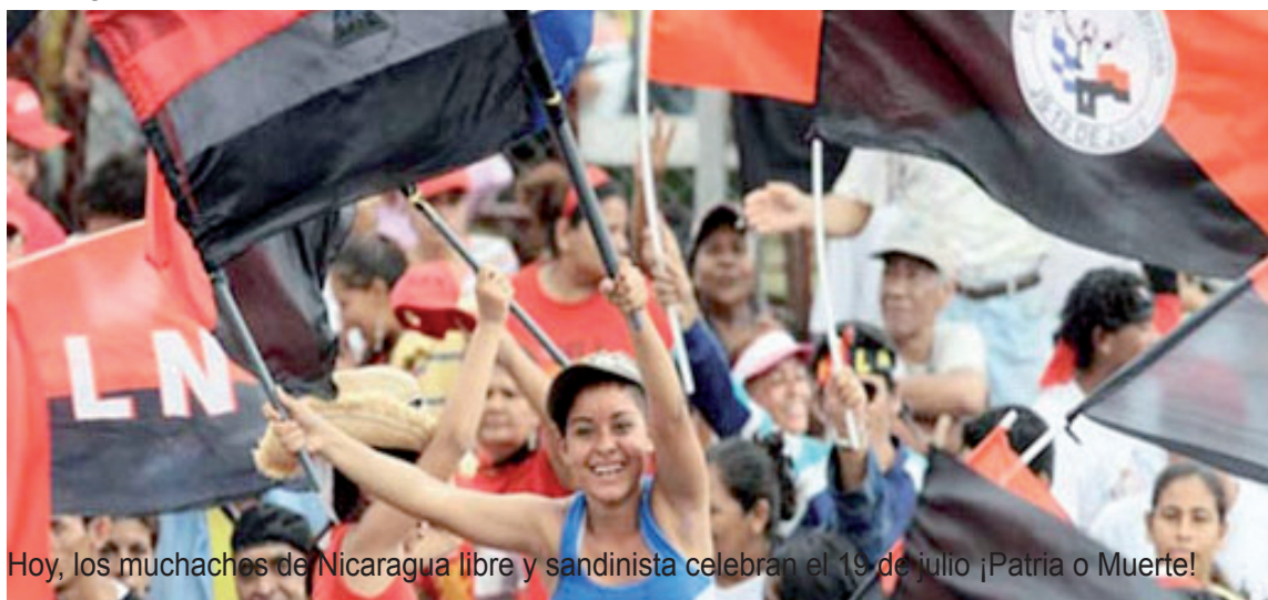
Hoy, los muchachos de Nicaragua libre y sandinista celebran el 19 de julio ¡Patria o Muerte!