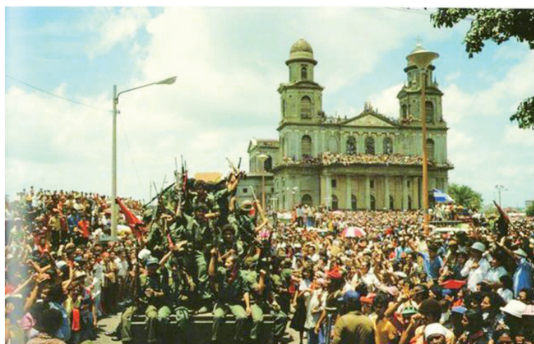
El momento de la llegada de los guerrilleros sandinistas a Managua el 19 de julio de 1979 todo el pueblo se fue a la calle, tal como hoy

POR ESO, A ESTA HORA ESTÁ LLENA LA PLAZA DE LA REVOLUCIÓN EN MANAGUA Y AQUÍ RECORDAMOS TODOS LOS ENVÍOS QUE HICIMOS EN ACTOS DE SOLIDARIDAD, A TODOS LOS COMPAÑEROS QUE SE FUERON A LUCHAR EN EL FRENTE SUR Y A TODA ESA EMOCIÓN DE VER TRIUNFAR A LA REVOLUCIÓN SANDINISTA QUE AÚN HOY PERMANECE Y, COMO CANTABA EL PANITA....."Y los fusiles servirán, para roturar los campos, para construir un gran barco que navegue airoso en el río San Juan....." ¡AGUA CLARA NICARAGUA...!