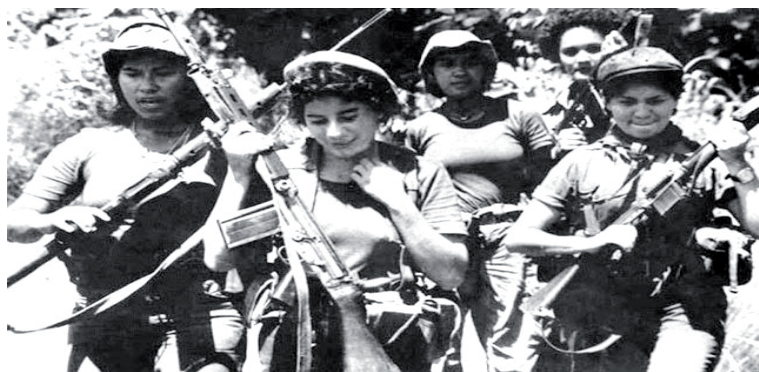
Las muchachas guerrilleras: bastión fundamental de la victoria sandinista