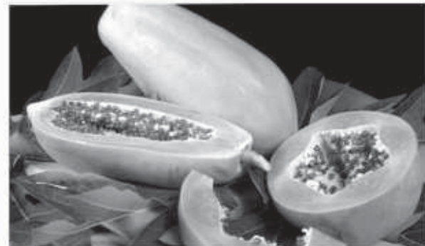
La lechosa, una buena aliada del estómago, consúmela a menudo.

Reducir la ingesta de productos lácteos que contienen lactosa de la dieta casi siempre alivia