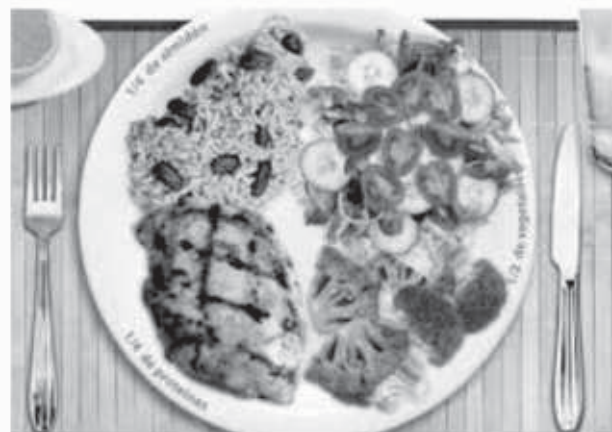
Una comida balanceada ayuda a prolongar la vida