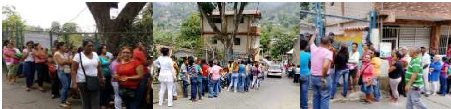
ESCUELA EL PARDILLO