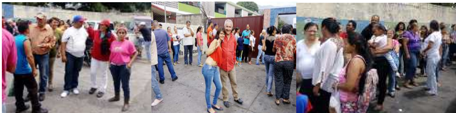
ESCUELA RAFAEL RANGEL