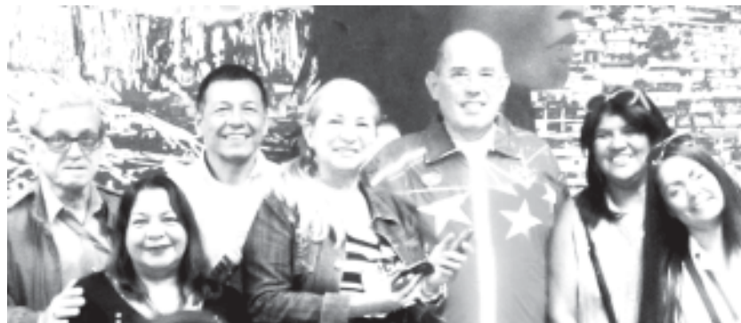
Dugarte Jefe de Gobierno con El Petarazo, El Capurro y otros

Las propuestas recibidas por el jefe de Gobierno, los voceros destacaron el papel y la importancia de cada medio comunitario