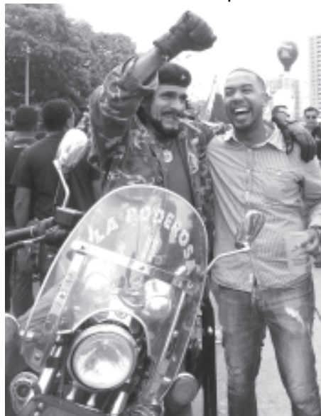
El CHE, nunca falta a las marchas

El presidente Maduro, quien se enfrenta a grandes intereses transnacionales y a los que se creen amos del mundo, cuenta con el respaldo de un pueblo aguerrido hijos de Bolívar y Chávez, que consientes de las decisiones que el mandatario debe tomar para frenar el desangramiento de Venezuela por mafias organizadas que golpean a este país con el bachequeo, contrabando de extracción, tráfico de droga y paramilitarismo, no dudan en brindar apoyo irrestricto a las medidas de cierre de fronteras tomadas por el Ejecutivo Nacional..