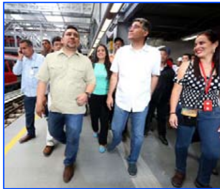
Los Teques, 07 Oct. AVN.