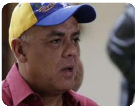
Caracas, 08 Oct. Este jueves el jefe de campaña del Comando Bolívar-Chávez, Jorge Rodríguez, alertó sobre planes orquestados por sectores de la derecha venezolana para desestabilizar y generar violencia en el país para afectar el desarrollo pacífico de los comicios parlamentarios del 6 de diciembre. - Pág. 12