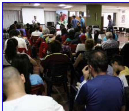
Caracas, 02.10.2015.

El Ministerio del Poder Popular para Ecosocialismo y Aguas (Minea), que dirige Guillermo Barreto, realizó un taller de formación sobre las acciones contra el cambio climático, con el propósito de configurar la posición de Venezuela para la Conferencia Mundial de los Pueblos sobre Cambio Climático que se llevará a cabo en Bolivia durante este mes.