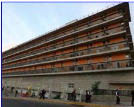
Caracas, 09 Oct.

La oficina de Amenidades Urbanas junto a la Gran Misión Saber y Trabajo convocan a la presentación de propuestas socioproductivas para el arrendamiento de locales ubicados en los urbanismos de la Gran Misión Vivienda Venezuela (GMVV) en la avenida Bolívar, en Caracas.