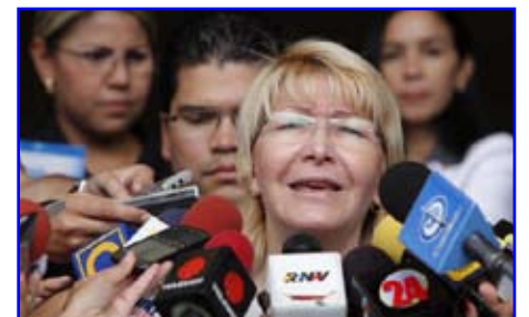
Caracas, 08 Oct.

Este jueves la fiscal General de la República, Luisa Ortega, acudió al Tribunal Supremo de Justicia (TSJ) para consultar el estatus sobre el recurso de interpretación solicitado al máximo tribunal respecto a cuál institución debe definir la figura jurídica de muerto y desaparecido durante las violaciones masivas de derechos humanos perpetradas durante los gobiernos de la IV República.