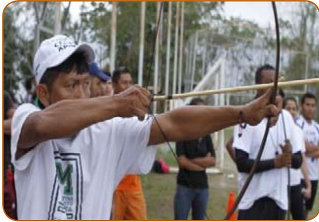
Caracas, 03 Oct. AVN.- Desde el 12 al 14 de octubre se llevará a cabo los V Juegos Deportivos Nacionales Indígenas en el Parque Recreacional Guaiquerí, ubicado en la ciudad de Cumaná del estado Sucre.

El viceministro para el Vivir Bien del Ministerio para los Pueblos Indígenas, Manuel Montiel, informó que en estos juegos se espera la participación de más de 1200 delegaciones de jóvenes provenientes de diferentes regiones del país.