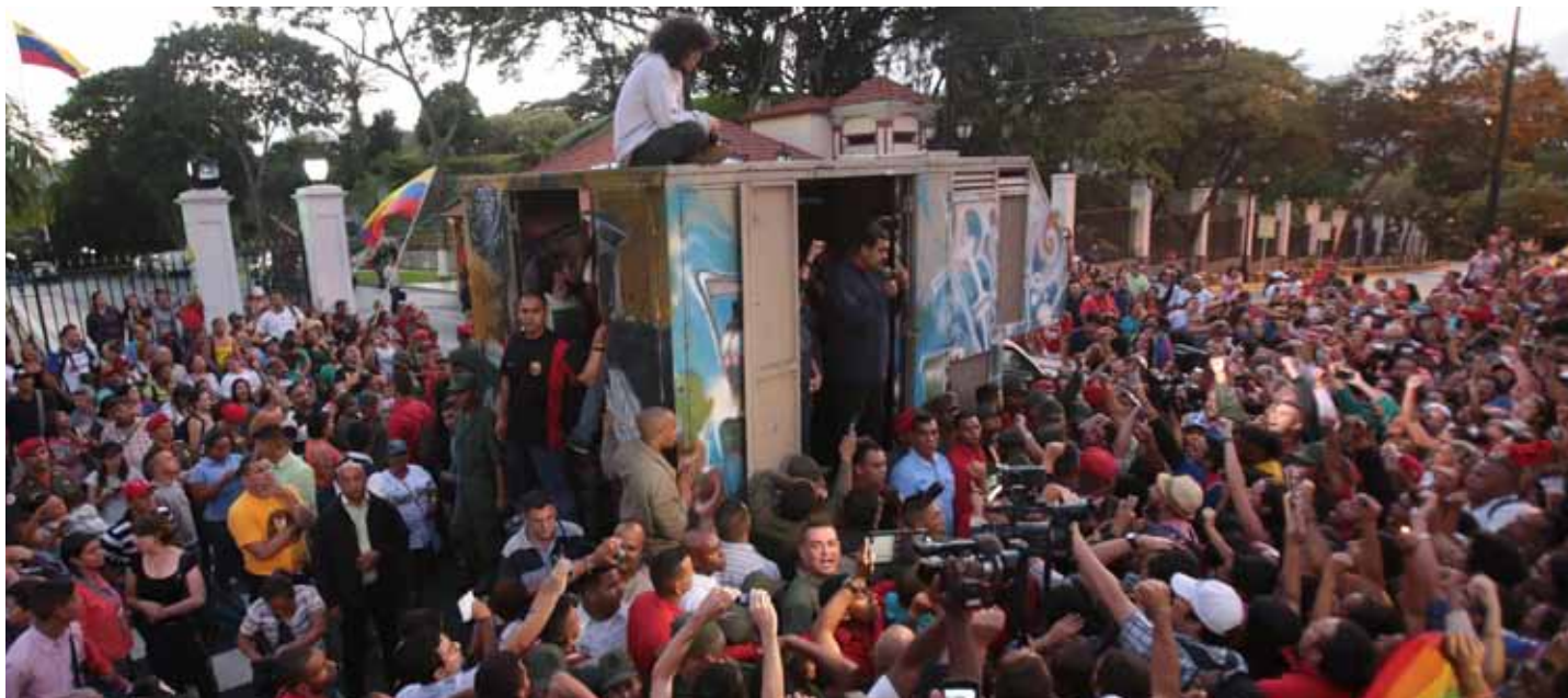
El 9 de diciembre, en Miraflores, un mar de pueblo le pidió al Primer Mandatario profundizar y reimpulsar la Revolución Bolivariana ante los próximos ataques que se ciernen desde la recién electa bancada opositora en la Asamblea Nacional que defiende los intereses de la oligarquía criolla y el imperialismo yanqui

Alertó el presidente Nicolás Maduro a quienes a esa tarde manifestaron su respaldo a la Revolución Bolivariana: "(...) O nosotros salimos de este atascadero por la vía de la Revolución o Venezuela va a entrar en un gran conflicto que va a afectar a toda la región latinoamericana y caribeña."