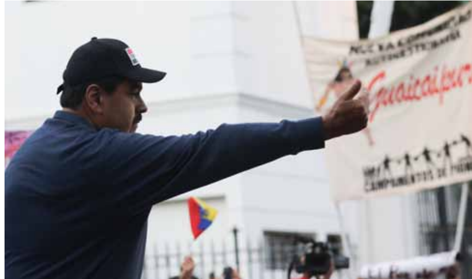
El presidente Maduro saludó a los movimientos populares que se han movilizado en defensa de la Revolución

Aquí hay una herida, la herida fundamental que explica este revés electoral circunstancial, sin lugar a dudas está en los daños humanos, políticos, en los impactos que creó