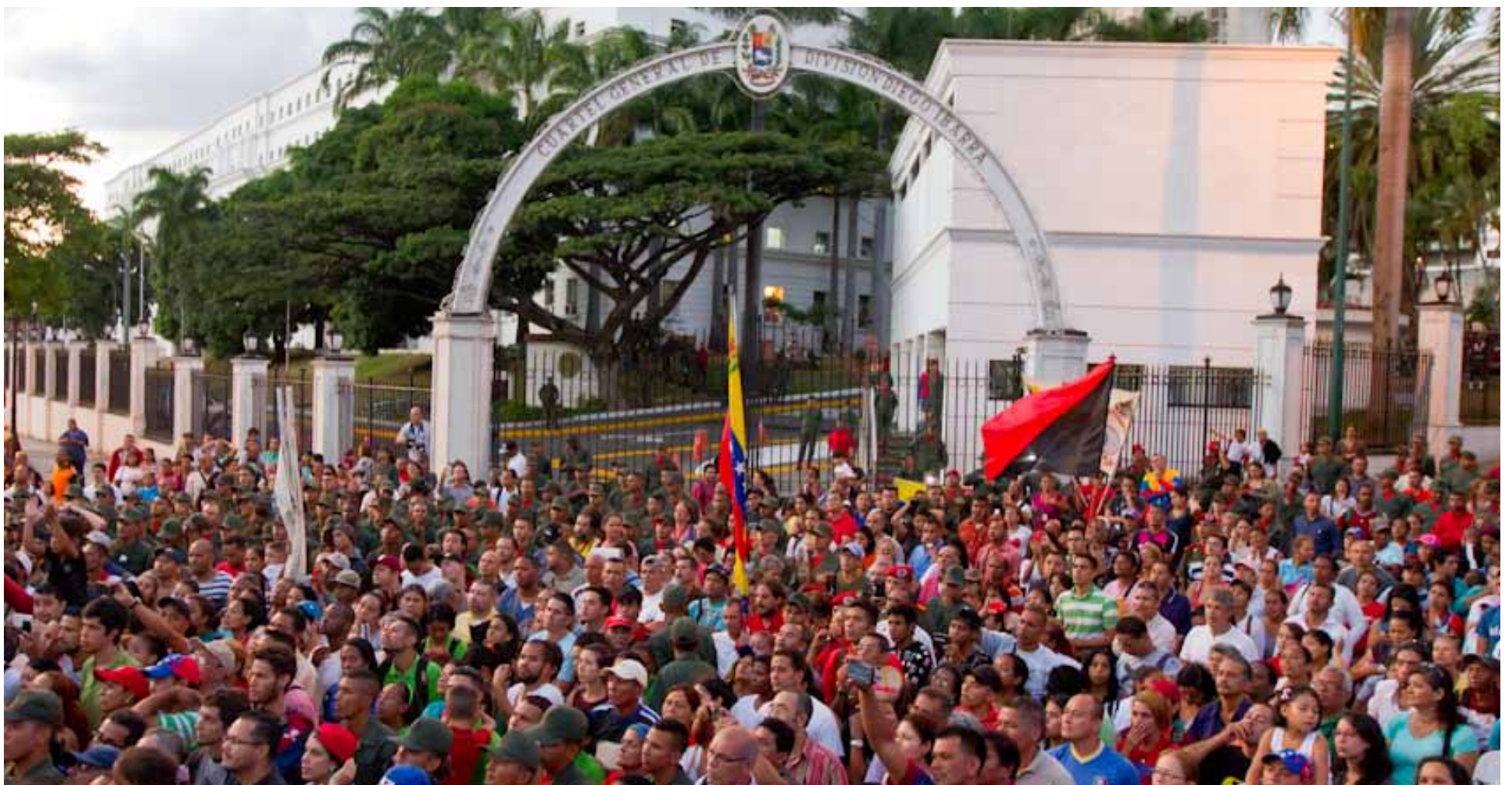
El pueblo leal se restea con la Revolución Bolivariana y el legado de Chávez, por amor a la Patria

Nosotros hemos ido encaminando nuestro país en paz, siempre hemos dicho: nuestra victoria es la paz; nuestra victoria es la democracia; nuestra victoria es encaminar los conflictos del país y resolverlos entre los venezolanos en ejercicio de nuestra soberanía