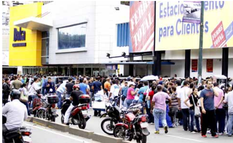
Durante dos años, el pueblo ha sido sometido a una guerra económica brutal, situación usufructuada por la oposición para manipular la intención de voto en las elecciones

En 2013: salimos sin nuestro Comandante a encabezar este pueblo, con un abrazo y tuvimos un triunfo heroico el 14 de abril; por 2 por ciento de diferencia y salieron a mandar a quemar este país.