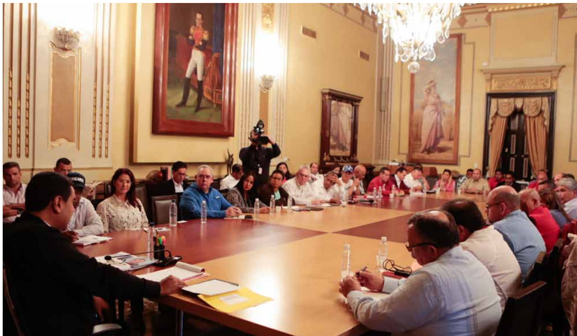
Los gobernadores bolivarianos y el Gabinete ministerial analizaron las circunstancias actuales, en reunión celebrada el 7 de diciembre de 2015

Hoy Fedecámaras salió a pedirle a su bancada, que ahora va a ser mayoritaria en la Asamblea Nacional, que derogue la Ley Orgánica