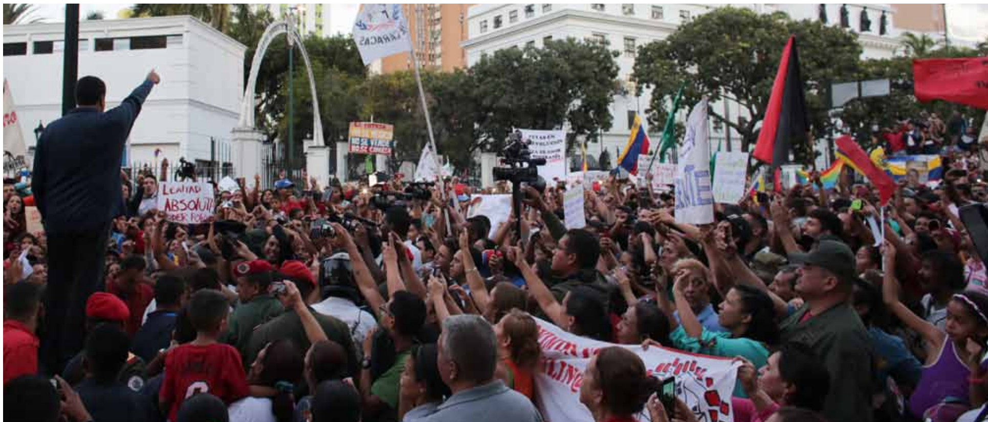
El pueblo chavista se congregó frente al Palacio de Miraflores para debatir y brindarle apoyo al presidente Nicolás Maduro, quien lo recibió a puertas abiertas, el día 9 de diciembre. Posteriormente, se celebrarán varios encuentros colectivos con el Presidente para presentar propuestas, críticas y planes

Unidos para poder enfrentar, con la mayor disposición moral y política, las circunstancias que nos va a tocar vivir en los próximos meses, cuando se pretenda imponer un plan contrarrevolucionario para dismantelar el Estado social democrático de justicia y de derecho