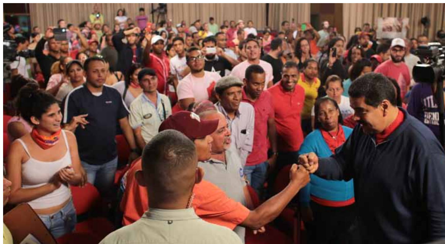
Una comisión del Poder Popular fue recibida en Miraflores por el presidente Maduro para presentarle varias propuestas, el 9 de diciembre de 2015

Igualmente, quiero enviar un saludo a todas las UBCH, estaban movilizadas todavía en las calles, un saludo a todos los movimientos sociales que se han movilizado durante toda esta semana, que han estado en las calles el día de hoy, llamo a todo nuestro pueblo a reconocer en paz estos re-