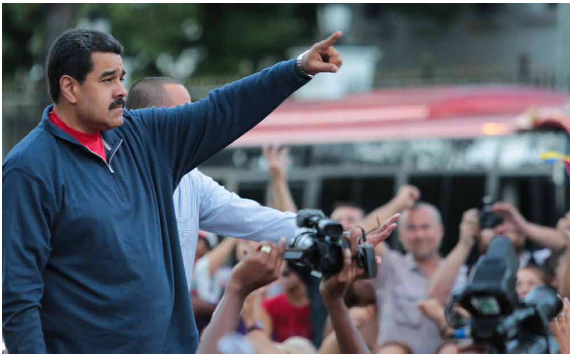
La unidad del pueblo y el Gobierno Bolivariano es necesaria para enfrentar la contrarrevolución

Lo primero que nosotros hemos acordado aquí es iniciar una cruzada por fortalecer la unión del movimiento revolucionario bolivariano de Venezuela a todo nivel, nacional, regional, sectorial... Hemos acordado que toda esta jornada debe tener un resultado, la unión profunda político, organizativa, ideológica, espiritual, humana, en esta circunstancia del movimiento revolucionario