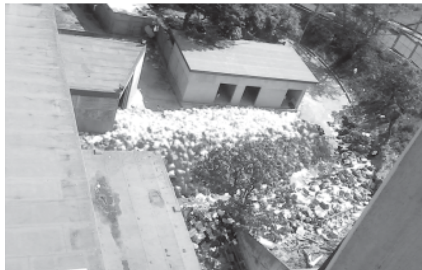
Se puede apreciar los desechos sólidos acumulados en el Hospital Domingo Luciani

De acuerdo con la investigación preliminar, el citado día, la mujer denunció ante el Comando Nacional Antiextorsión y Secuestro de la GNB que un agente aduanero le habría solicitado la cantidad de 12 mil bolívares, con la excusa de que ese era el monto que exigían los efectivos castrenses para autorizar la exportación de los bienes.