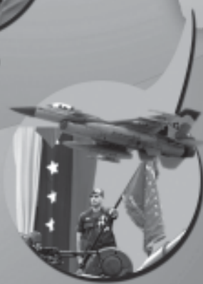
SEGURIDAD Y DEFENSA