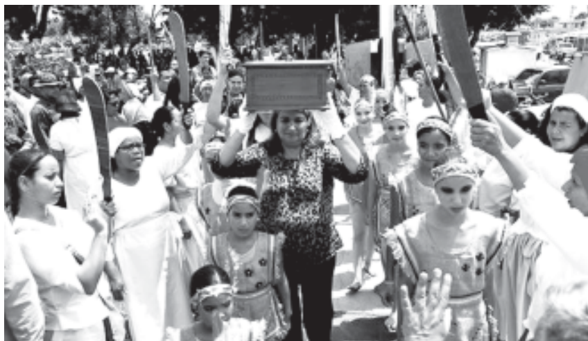
Escenario del traslado de Juana La Avanzadora