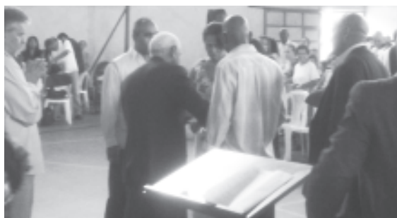
El apostol unta el aceite para las familias