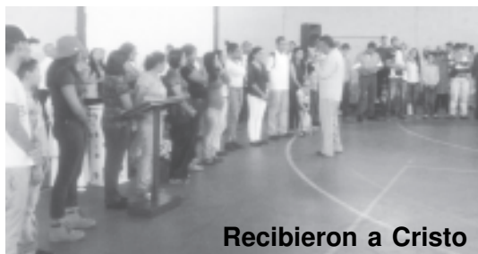
Recibieron a Cristo