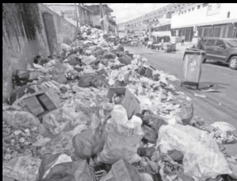
Petareños reclaman solución inmediata al problema de la basura