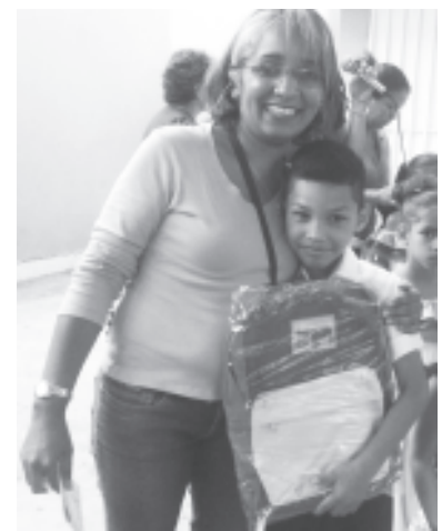
Maestra y alumno feliz por el moral

Con la presentación de diferentes actos culturales se llevo a cabo en la E.B.N Julio Calcaño, la entrega de morrales, a niñas y niños de ese plantel como politica de inclusion derl Gobierno Bolivariano por medio