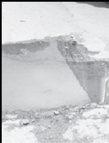
Huecos en las calles