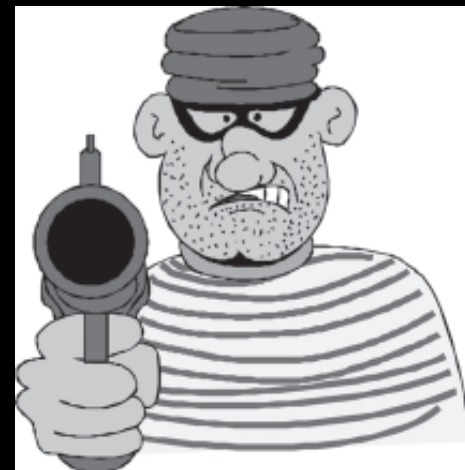
A diario: DELINCUENCIA y CAOS en Petare

Piensa bien lo que vas a hacer el 6D correcciones las que sean, retroceder jamas