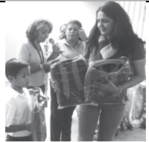
Entrega de manos de la directora