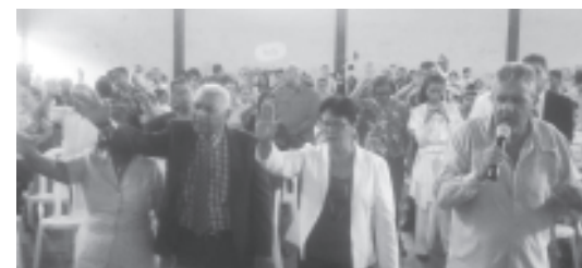
Predican por el amor y la paz