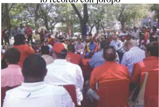
¡Chávez, dijiste por ahora y quedaste sembrado en el corazón del pueblo!