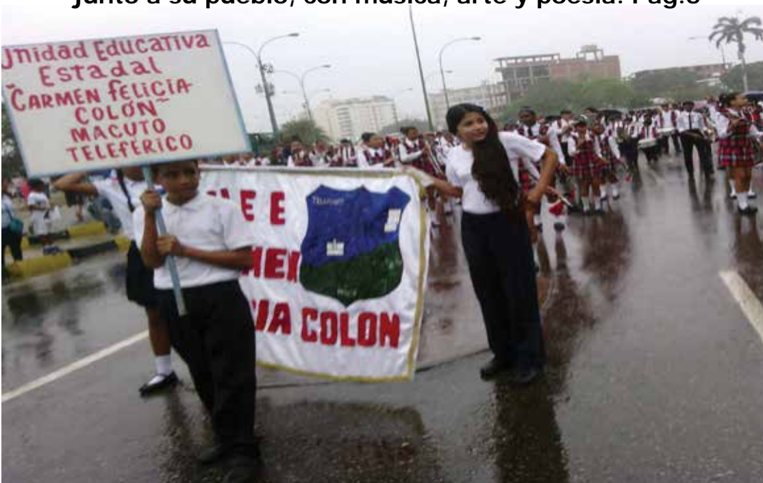
Escuela Carmen Felicia Colón, de El Teleférico en desfile recordando los 230 años del nacimiento de nuestro prócer Guayreño José María Vargas. Pág. 10

La mujer latinoamericana mejor educada pero mal pagada. Pág. 3