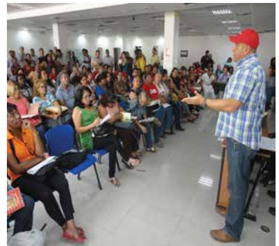
Transferencia al poder popular realiza CANTV en Catia. Pág. 7