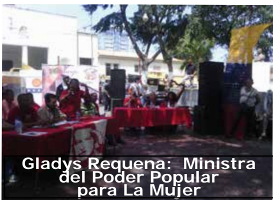
Gladys Requena: Ministra del Poder Popular para La Mujer