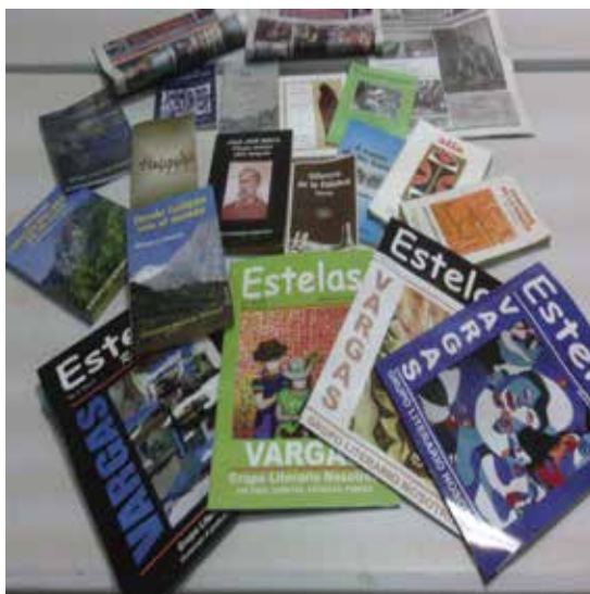
Parte de la producción de la editorial del Grupo Literario Nosotros