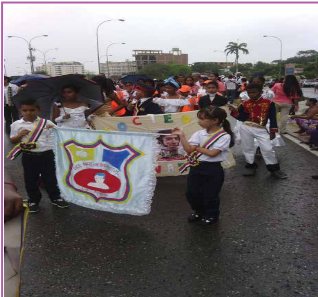
Niñas, niños de la Unidad Educativa Miguel Valentin Hostos desfilaron bajo la lluvia el Día de Vargas, recordando el nacimiento de nuestro prócer José María Vargas, el pasado 10 de marzo.

Vargas celebró su día de fiestas, el 10 de marzo en la ave. José María España, de Macuto