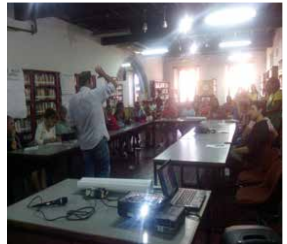
Lanzamiento Primer Congreso de La Patria, Gab. Cultura Vargas. Pág.7