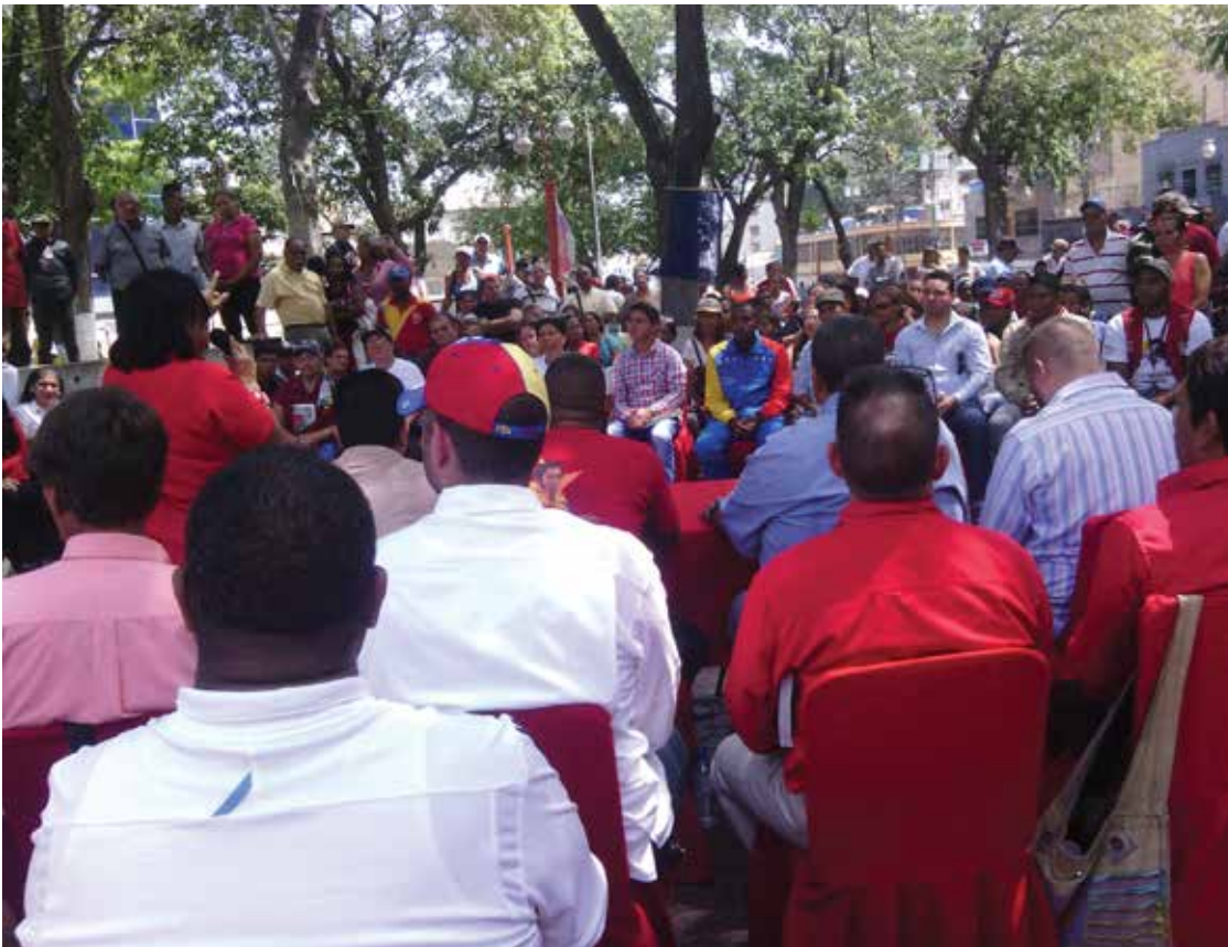
Sesión extraordinaria a cielo abierto del Consejo Legislativo, en la plaza Los Maestros de Maiquetía para conmemorar los tres (3) años de la siembra del comandante Hugo Chávez junto a su pueblo, con música, arte y poesía. Pág.5

Medio Alternativo Comunitario Premio "Fabricio Ojeda" 2012 Año 6. N°. 49, marzo de 2016