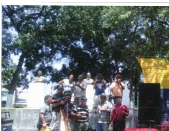
Agrupación Folklórica Araguaey lo recordó con joropo