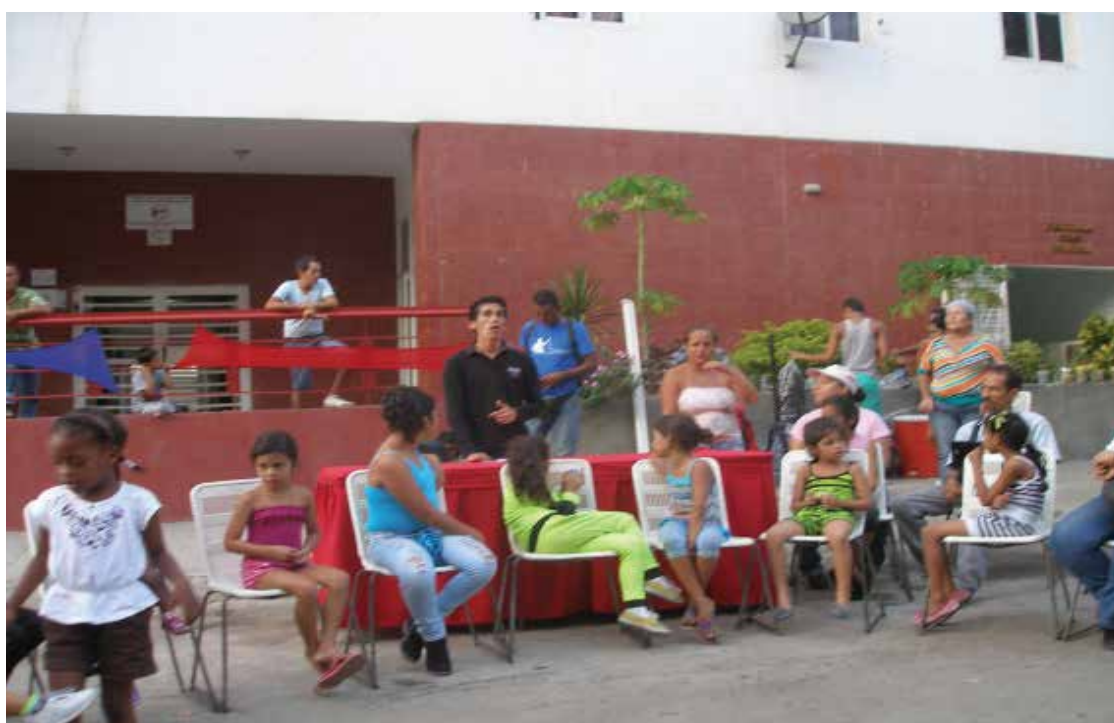
Niñas y niños en la UPP22 de Tanaguarena acompañaron a sus padres y representantes en Homenaje al Comandante Chávez