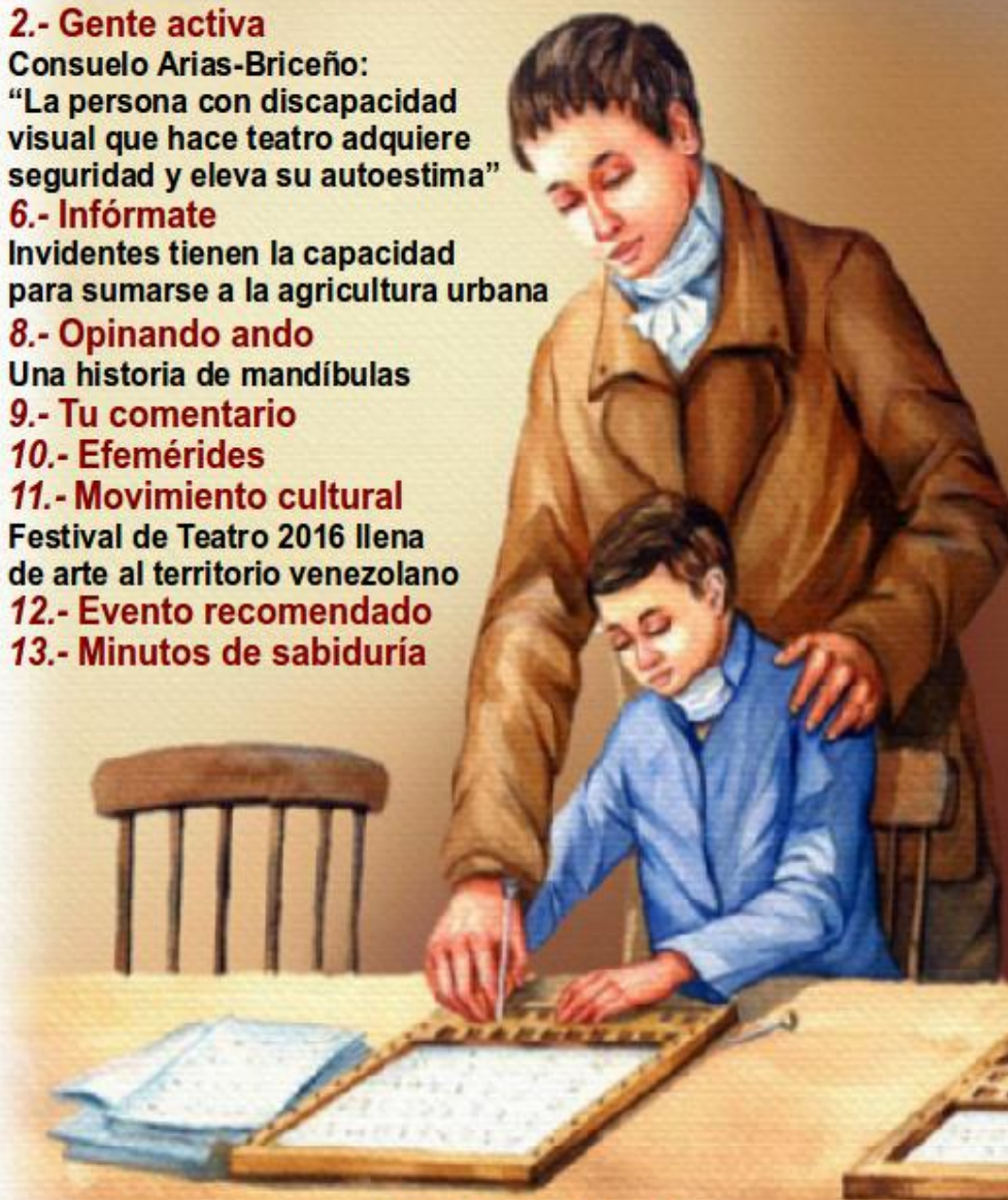
LOUIS BRAILLE CREADOR DEL SISTEMA DE LECTO-ESCRITURA PARA CIEGOS