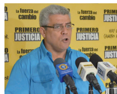
Marquina sugirió un patrullaje permanente en la zona atlántica.

“Lamentamos que (Nicolás) Maduro haya pretendido politizar el tema durante su alocución en la AN”, agregó en rueda de prensa. Dijo que se debe implementar un patrullaje permanente de la Armada venezolana en la fachada atlántica.