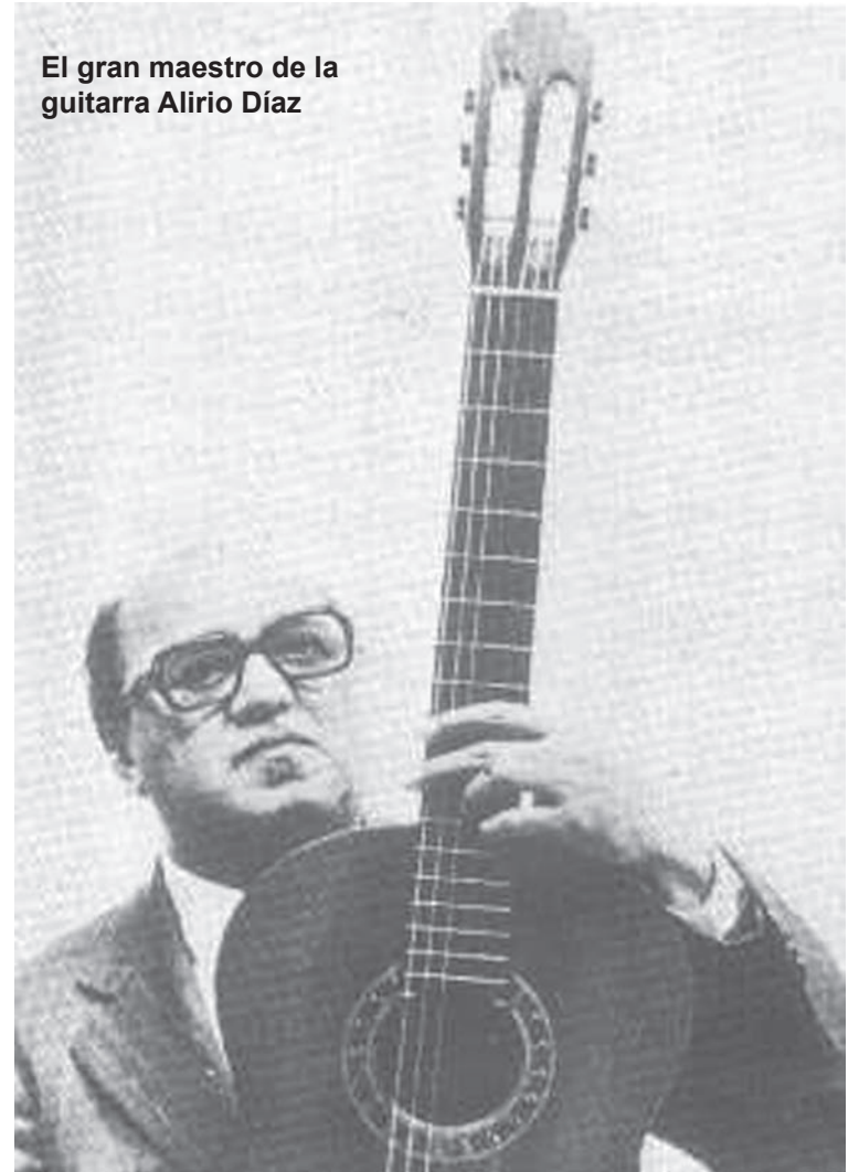
El gran maestro de la guitarra Alirio Díaz

de músicos clásicos europeos, así como de la música popular latinoamericana y venezolana.