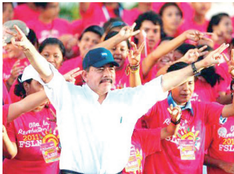
Comandante Daniel Ortega presidente de Nicaragua