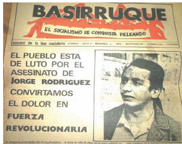
Portada de "BASIRRUQUE" Periódico alternativo que editaba la Liga Socialista