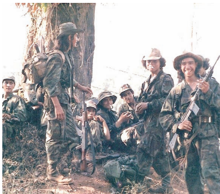
La Revolución Sandinista fue una Revolución de muchachos guerrilleros....y siempre lo será

Hoy, Nicaragua celebra y Latinoamérica la acompaña