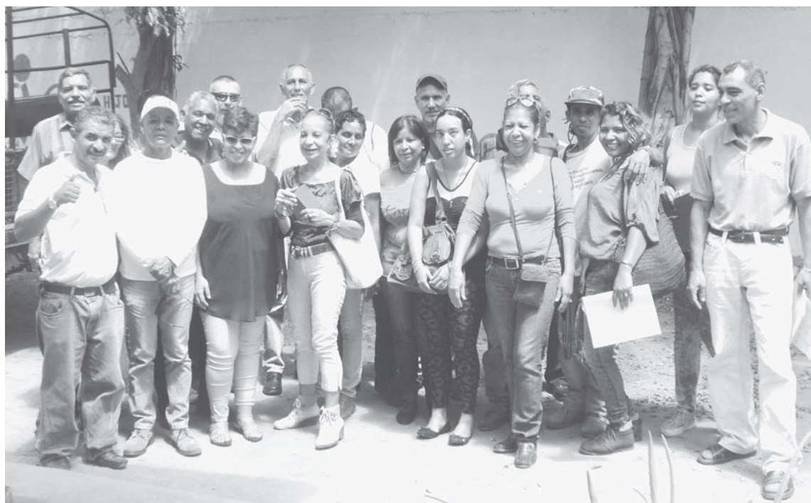
Algunos de los comunicadores participantes en la Asamblea

diversos vaivenes del Congreso de la Patria adquiere gran relevancia esta ley y