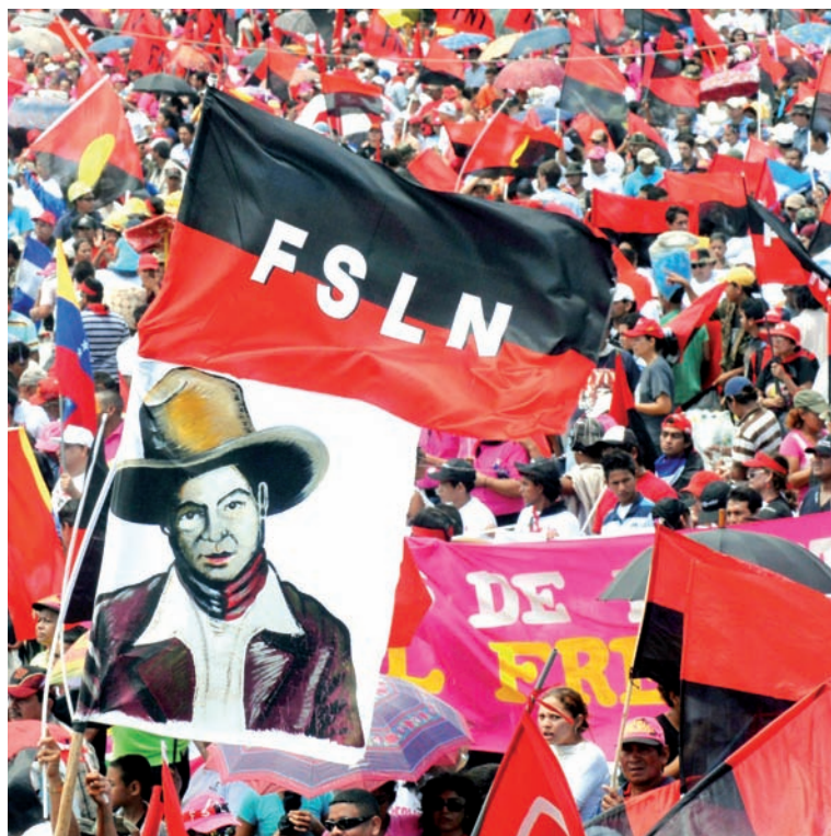
El pueblo nicaragüense celebra emocionado la victoria contra el fascismo y el imperialismo

Adelante marchemos compañeros avancemos a la revolución nuestro pueblo es el dueño de su historia arquitecto de su liberación.