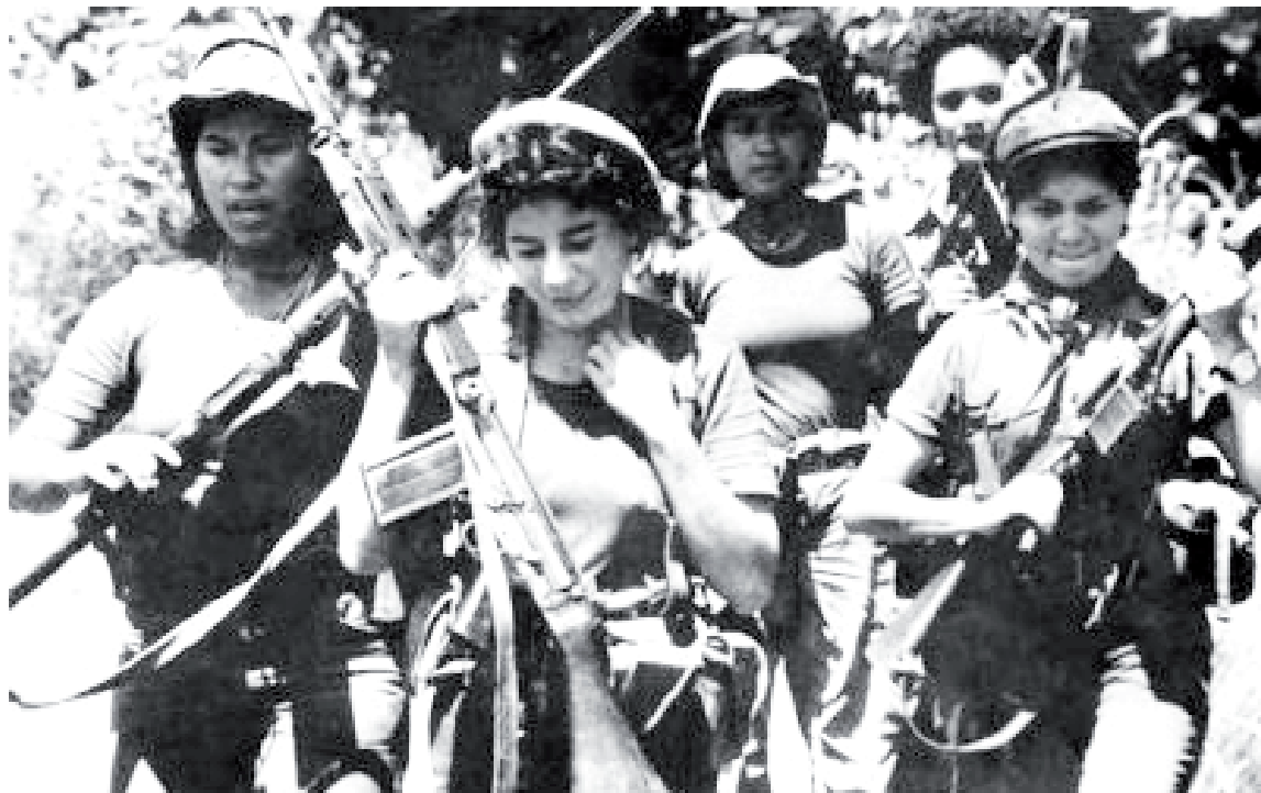
Las muchachas guerrilleras sandinistas dieron su aporte en valor, sangre y sacrificio por su patria

¡ VIVA LA REVOLUCION NICARAGUENSE EN SU 37 ANIVERSARIO!