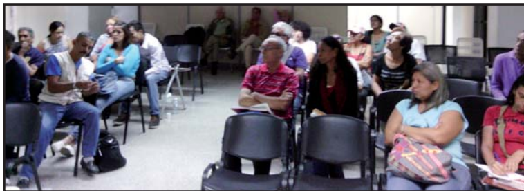
Voceras y voceros de medios alternativos y comunitarios se reunieron para evaluar acciones ante la reforma de la Ley Orgánica de Telecomunicaciones