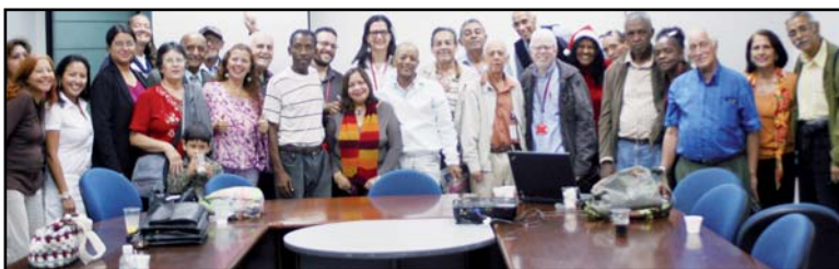
La foto del año: Voceras y voceros de Medios Alternativos y Comunitarios y trabajadoras y trabajadores de la Nueva CANTV plasman la reanudación de los espacios colectivos.

Sin embargo, luego de una justa expresión de inconformidad por parte de los MAC y de las respectivas aclaratorias por parte de CANTV fueron reanudadas las actividades quincenales de la Mesa de articulación y la relación comercial de mutua solidaridad MAC CANTV. Abriéndose grandes perspectivas para el próximo año.