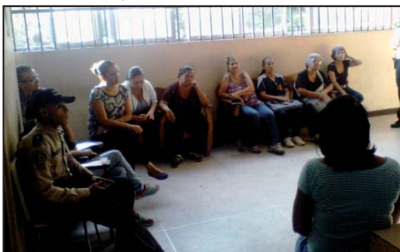
Voceras de la Comuna en Construcción Casco Central Candelaria y de la comunidad en general.

Voceras y voceros de Medios Alternativos, Comunitarios y Populares en el MIPPCI