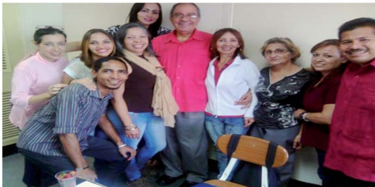
Los futuros comunicadores sociales del séptimo semestre en Comunicación Social Aldea Universitaria Andrés Bello

Durante el acto los triunfadores dieron a conocer todo el proceso de investigación que han desarrollado en la comunidad de Teñideros en la Parroquia Candelaria, junto al Consejo Comunal Teñidero y el medio