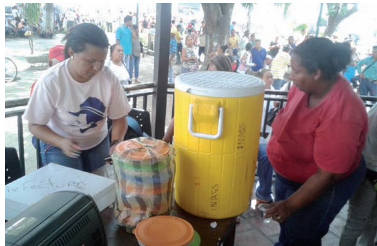
En la foto se observa representantes de diferentes entes haciendo su trabajo revolucionario