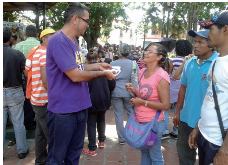
Interprete de lengua de seña entregando el carnet

Aquí tenemos el listado de la misión Hogares de la Patria. Se le da la información y se les ayuda a buscar en el lista, continuo diciendo :Aquí no nos paramos tratamos de darle repuesta al pueblo. El presidente eterno Hugo Chávez:: Nos dejo mejores condiciones para continuar nuestra lucha por una Venezuela próspera y justa.