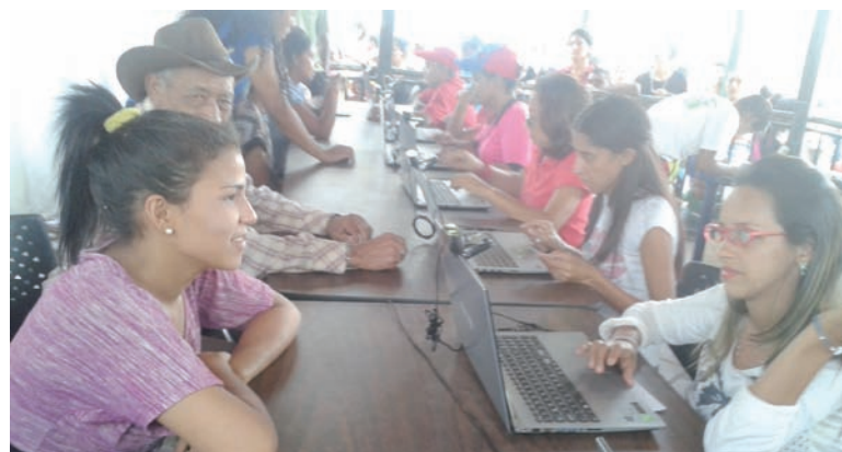
En este operativo juventud niños y adulto mayor realizando su censo