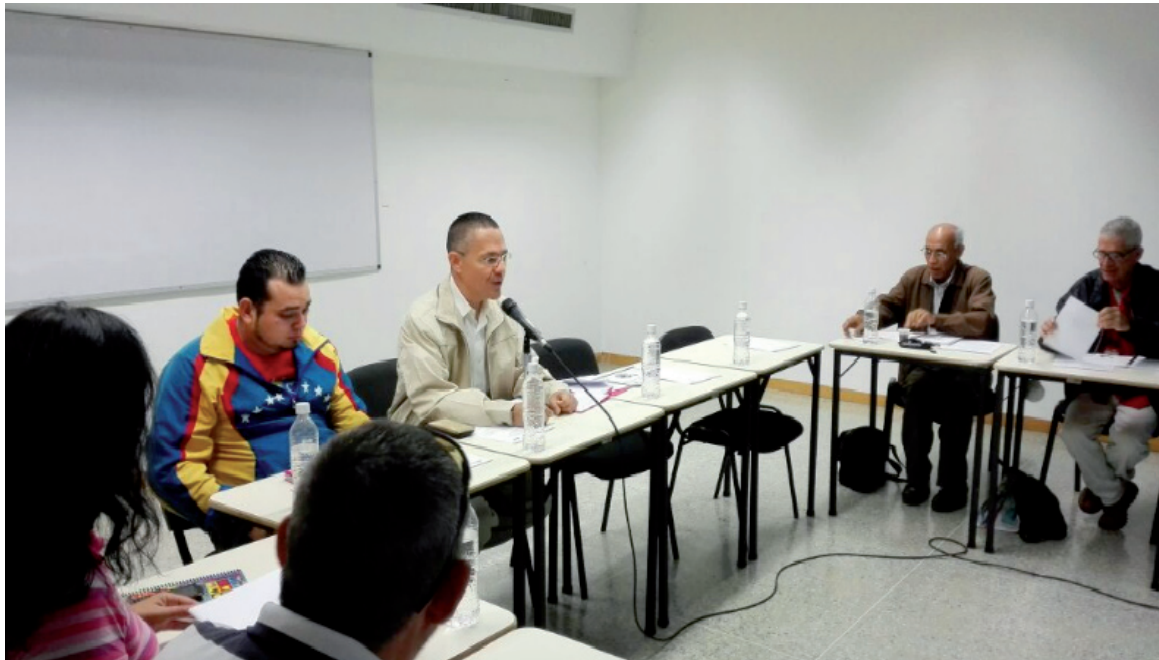
El ministro de Comunicación e inf. Ernesto Villegas, y el director de los medios alternativos y comunitarios en reunión con los medios de comunicación

El debate estuvo protagonizado por voceros y voceras de los Medios Alternativos y Comunitarios (MAC), a nivel nacional, centrados en concluir la versión final del Reglamento de la Ley de Comunicación Popular. El encuentro estuvo liderado por Angelo Rojas, Director General de Medios Alternativos y Comunitarios (DGMAC), conjuntamente