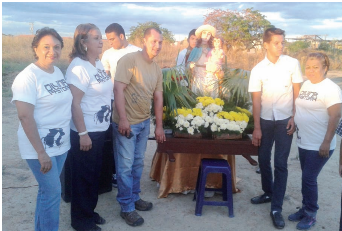
Un equipo formado por la misma comunidad que se encarga de llevar a cabo las actividades como fue el día de la Divina Pastora con participación de la comunidad de otros sectores.