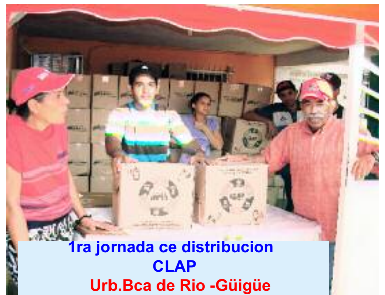
1ra jornada de distribución CLAP Urb.Bca de Rio -Güigüe