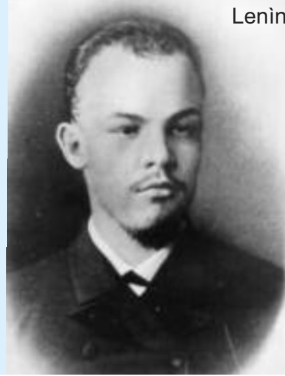
Lenin a los 23 años

cia, han revelado qué amenaza puede representar para el capital los obreros organizados. Los trabajadores han comprobado cómo de su trabajo viven y se enriquecen los capitalistas y el gobierno. Se ha encendido en ellas el deseo de luchar unidos, la aspiración a la libertad y el socialismo.