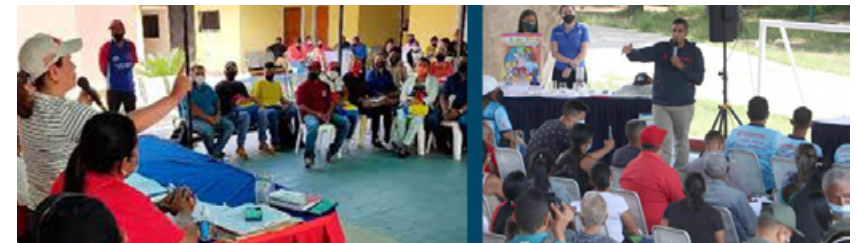
Consejo Comunal

La especialista en derechos humanos indica que la Organización de las Naciones Unidas está en un momento en el que debe tener una revisión profunda de sus estructuras, de sus instancias y de las concepciones ideológicas que la gobiernan, a fin de considerar a las nuevas maneras organizativas que han surgido en los últimos tiempos.