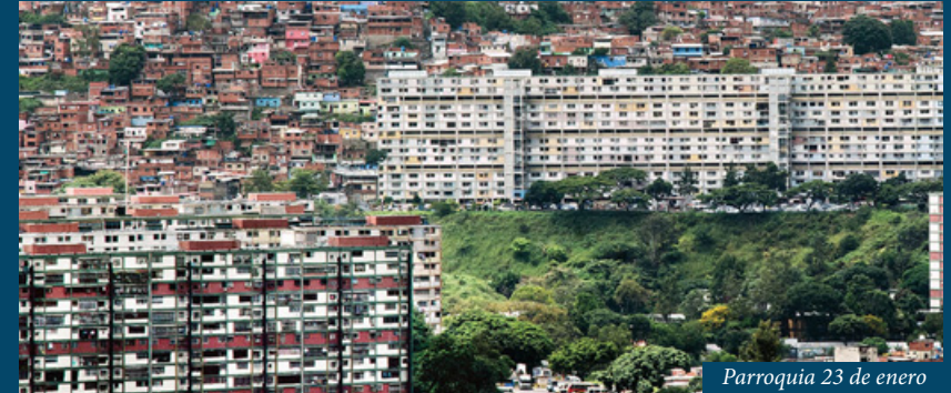
Parroquia 23 de enero