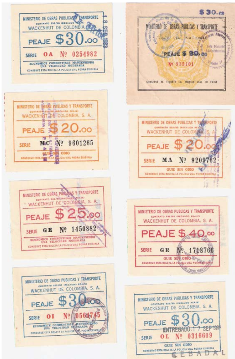
Peajes diversos del trayecto por rutas colombianas, 1983.