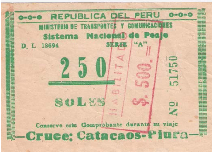
Peaje de ruta en Perú, 1983.