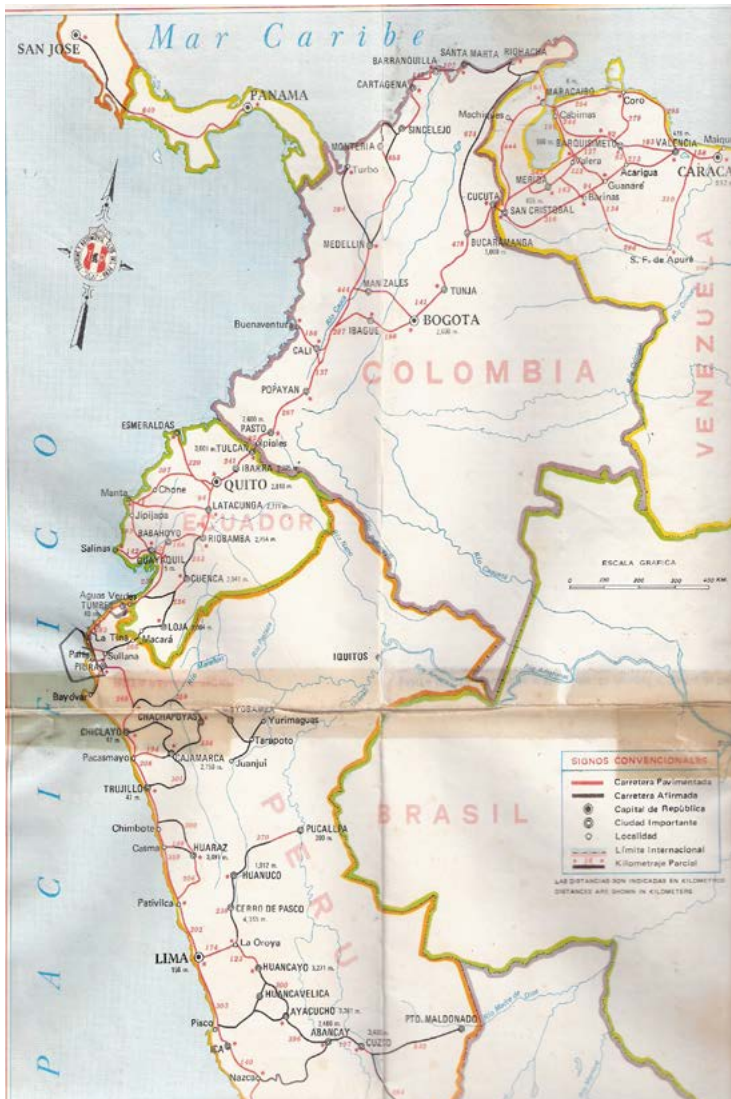
Mapa carretero utilizado en la oportunidad y que muestra el recorrido desde Catia La Mar, Venezuela, hasta el sur de Perú.