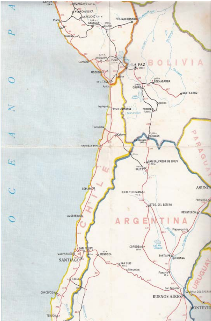
Mapa carretero utilizado en la oportunidad y que muestra el recorrido desde el sur de Perú hasta la ciudad de Córdoba, Argentina.