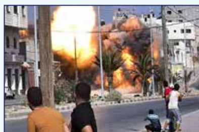
✓ 2011: Condena la invasión estadounidense en Libia