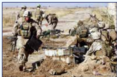
✓ 2001: Condena la invasión estadounidense en Afganistán