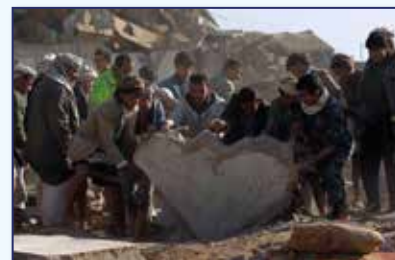
✓ 2010: Condena a Israel por ataques contra pueblo palestino