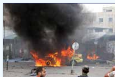
✓ 2012: Condena el injerencismo estadounidense en Siria