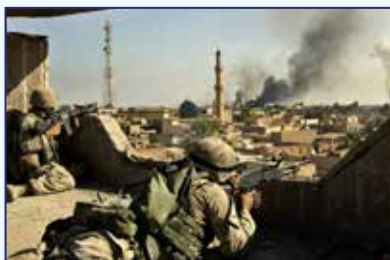
✓ 2003: Condena la invasión estadounidense en Irak